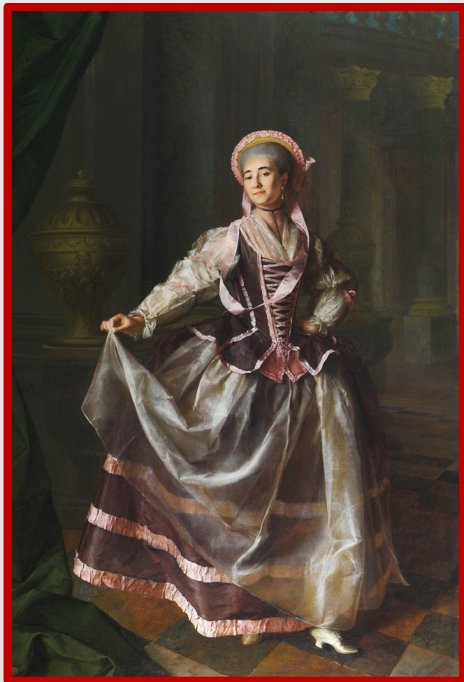
Портрет Александры Левшиной. Картина Дмитрия Левицкого, 1775 г. Государственный Русский музей.