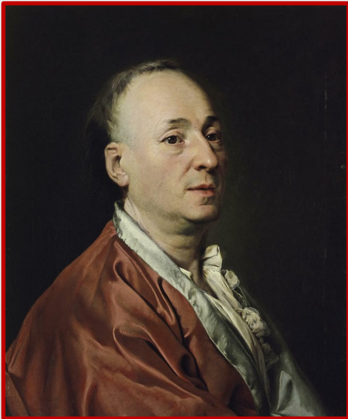
Портрет Дени Дидро. Картина Дмитрия Левицкого, 1773.