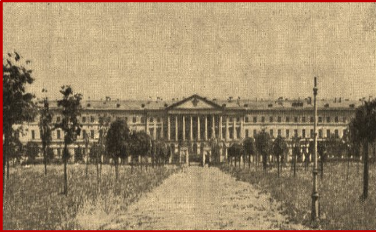
Смольный институт. Фотография, вторая половина XIX в.

На каждую девушку, поступавшую в институт, ассигновалось по 50 рублей; эти деньги клались на её имя в банк и ко времени окончания курса, вместе с накопившимися процентами считались её приданым. Часто само учебное заведение выдавало воспитанницу замуж, а если это не удавалось, то определяло её в учительницы, получая за неё жалованье. Никуда не пристроившиеся выпускницы имели право жить в институте, получая там комнату, пищу и свечи, оплачивая за это рукодельем, трудолюбием и добродетелью.