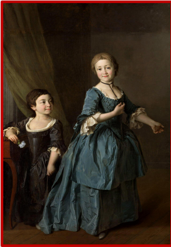
Портрет Настасьи Давыдовой и Феодосии Ржевской. Картина Дмитрия Левицкого, 1772 г. Государственный Русский музей.

Первоначально учебное заведение размещалось в помещении Воскресенского Новодевичьего женского монастыря (архитектор Ф. Б. Растрелли), располагавшегося в окрестностях столицы, неподалёку от деревни Смольной, – там в петровские времена располагался Смольный двор, отсюда более распространённое название училища – Смольный институт благородных девиц .