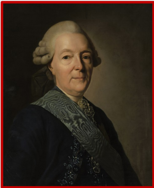
Портрет И. И. Бецкого кисти неизвестного художника, вторая половина XVIII в.