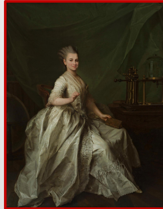
Портрет Екатерины Молчановой. Картина Дмитрия Левицкого, 1776 г. Государственный Русский музей.

В XIX веке Смольный институт становится всё более замкнутым, привилегированным учебным заведением, в котором воспитанницам прививались светские манеры, сентиментальность и преклонение перед царской фамилией.