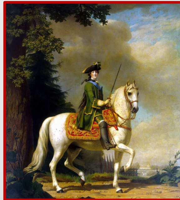
Портрет Екатерины II в гвардейском мундире на коне Бриллианте