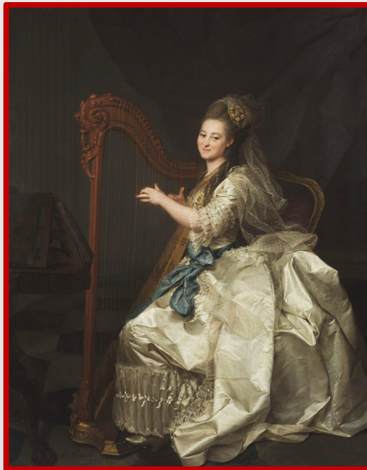
Портрет Глафиры Алымовой. Картина Дмитрия Левицкого, 1776 г. Государственный Русский музей.