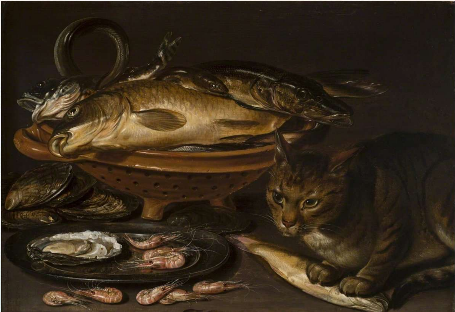
Клара Питерс Натюрморт с рыбами и кошкой После 1620