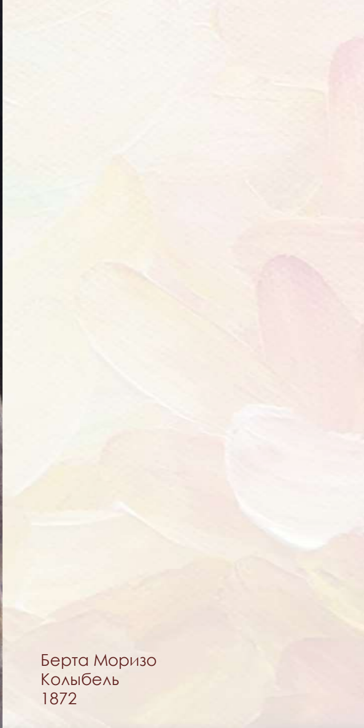
Берта Моризо Колыбель 1872