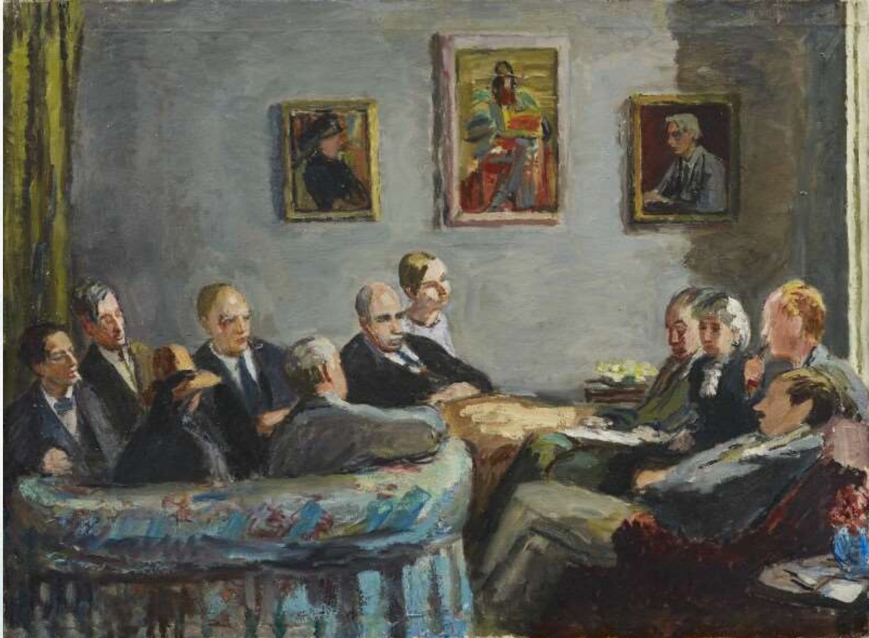
Ванесса Белл Клуб мемуаристов Около 1943