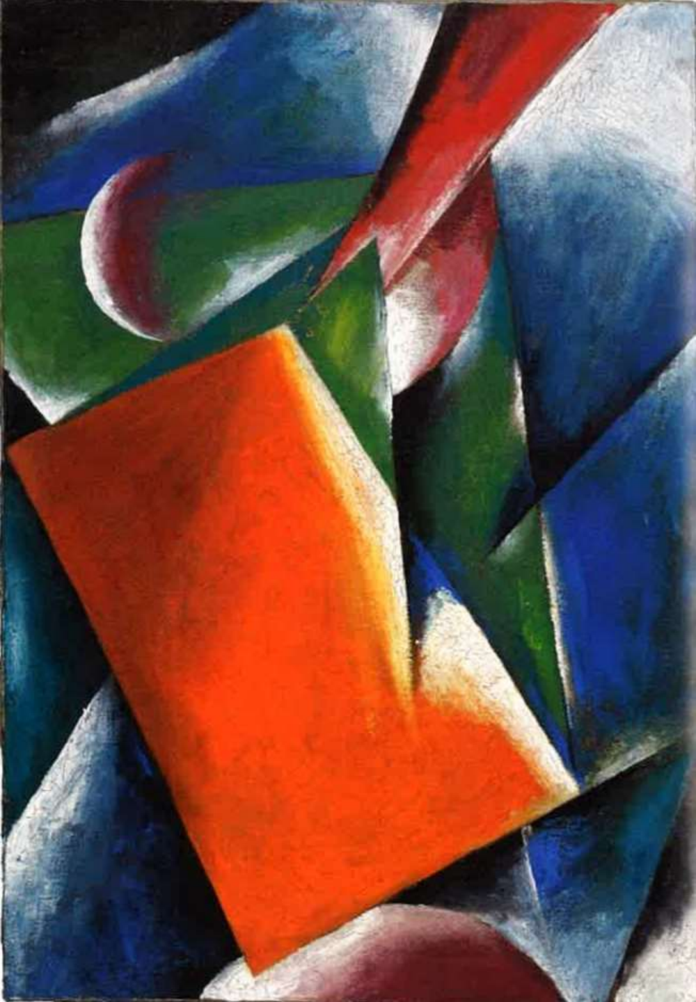
Любовь Попова Живописная архитектура 1917