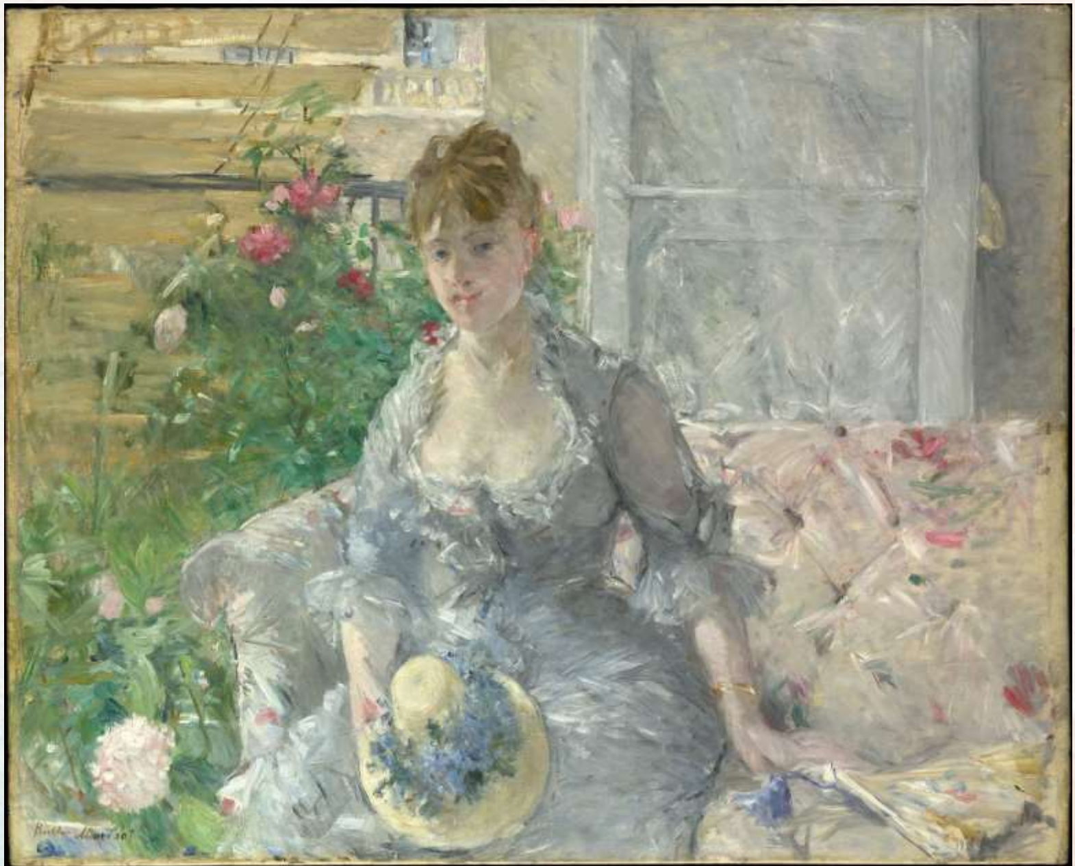
Берта Моризо Молодая женщина, сидящая на диване Около 1879