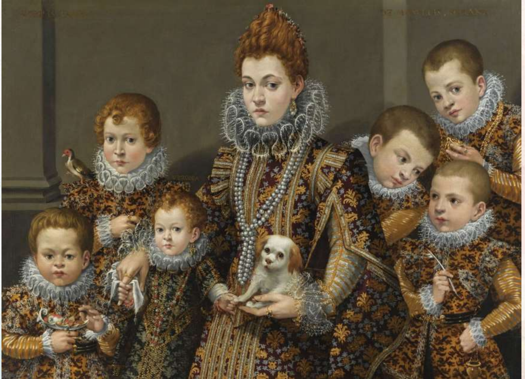
Лавиния Фонтана Портрет Бьянки дельи Утили Мазелли в интерьере с шестью ее детьми и собачкой Около 1600