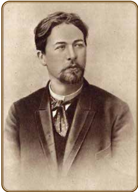
А. П. Чехов. 1885 г.