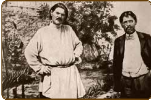
А. М. Горький и А. П. Чехов в саду ялтинского дома. 1900 г.