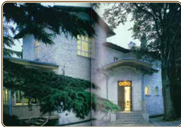
Дом-музей А. П. Чехова в Ялте

«Вся белая, чистая, легкая красиво несимметричная, построенная вне какого-нибудь определенного архитектурного стиля, с вышкой в виде башни, с неожиданными выступами, со стеклянной верандой внизу и с открытой террасой сверху...».