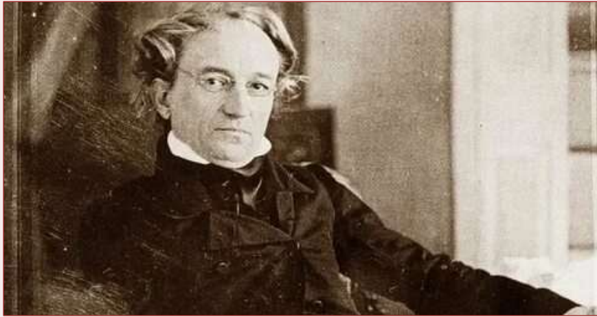
Ф. И. Тютчев

С 1837 по 1839 год И. Ф. Тютчев проходил службу в Турине (Италия). За границей поэт прожил 22 года, лишь иногда приезжая в Россию.