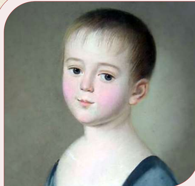
Ф. И. Тютчев в детстве

Ко дню рождения отца, 13 ноября, будущий поэт написал стихотворение, и называлось оно «Любезному папеньке». Юному стихотворцу тогда еще не исполнилось одиннадцати лет.