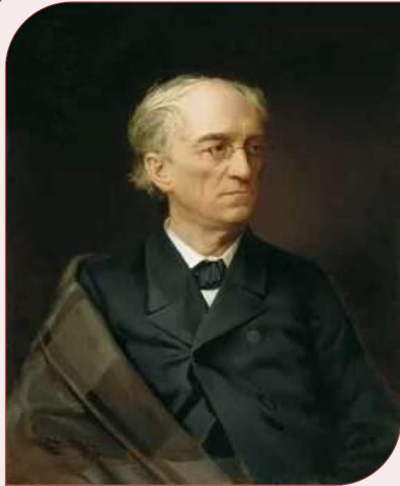
Ф. И. Тютчев

За свою долгую жизнь Федор Иванович был свидетелем многих «роковых минут» истории: Отечественная война 1812 года, восстание декабристов, революционные потрясения в Европе 1830 и 1848 годов, реформа 1861 года ... Все эти события не могли не волновать Тютчева и как поэта, и как гражданина.