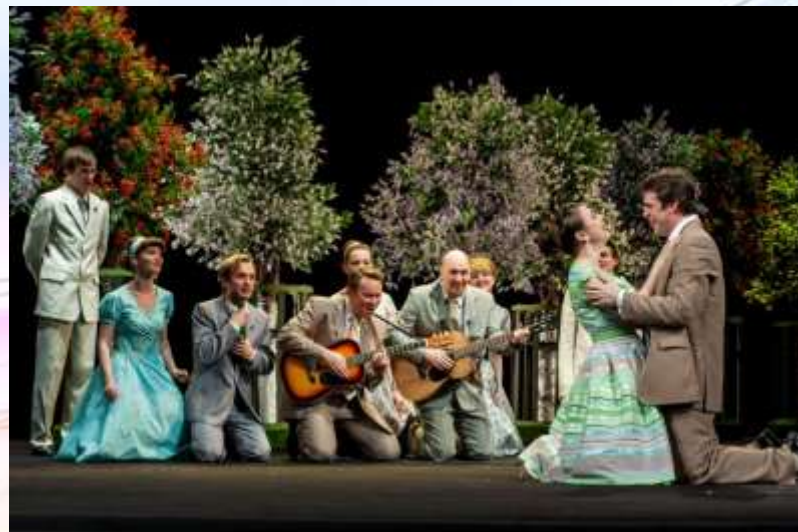
Постановка пьесы «Прощание в июне»

Удивительно талантливые, пронзительные сочинения оценили уже после смерти автора. Спустя годы пьесы «Старший сын» и «Утиная охота» были экранизированы и заняли свое место в «золотом фонде» советского кинематографа.