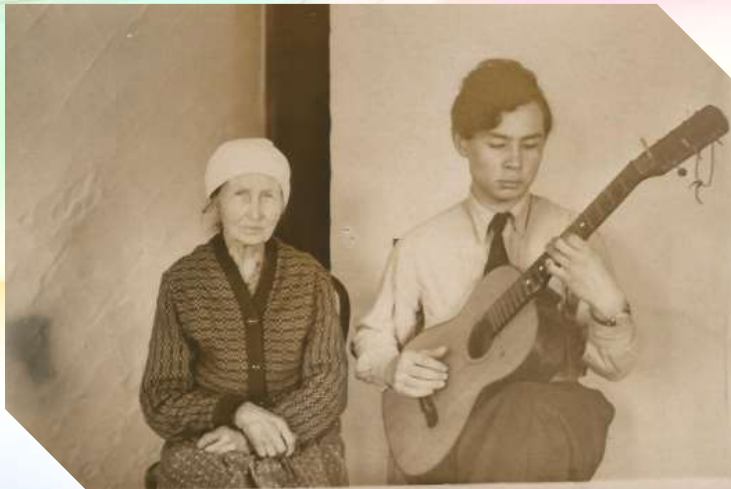
Александр Вампилов в школьные годы

В детстве Александр Вампилов мало чем отличался от ровесников: гонял мяч на футбольном поле, с классом бывал в походах, научился играть на мандолине и гитаре. Он не любил точные науки, предпочитая им чтение. В мир театра и драматургии Саша окунулся в школе: мальчик выходил на сцену школьного театра, играл в самодеятельных постановках. Писать тоже начал в школе: рифмовал стихи, редактировал стенгазету.