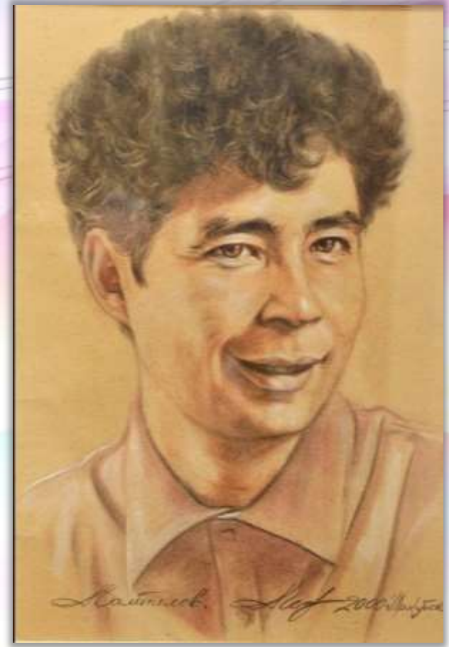
Александр Валентинович Вампилов (1937 – 1972 гг.)

Александра Вампилова запомнили как талантливого драматурга, прозаика и сценариста. Он своим творчеством напоминал представителя совсем другой эпохи. Писатель всегда балансировал между обыденным и рискованным, метался в поисках собственного пути, подкупал искренностью и честностью. Александр писал пьесы и рассказы, хотя его самое важное произведение так и не было написано. Вампилов не получил признания при жизни, может, от того, что сама жизнь его была очень короткой, как полет мотылька.