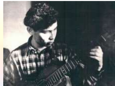
Александр Вампилов в молодости