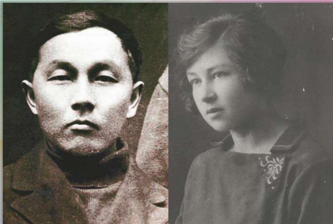
Родители Александра Вампилова