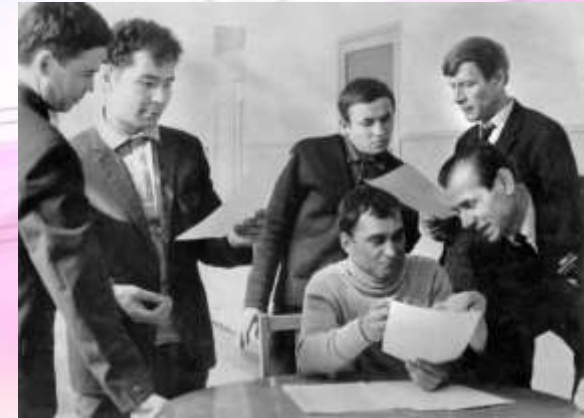
А. В. Вампилов в кругу коллег

Творческая биография Александра Вампилова началась на последнем курсе вуза. Его приняли на должность литературного сотрудника газеты «Советская молодежь», где он работал вплоть до 1964 года. За эти годы молодой человек продвинулся по карьерной лестнице и стал ответственным секретарем. Даже после увольнения Вампилов продолжал сотрудничать с редакцией и бывал в командировках по ее заданию.