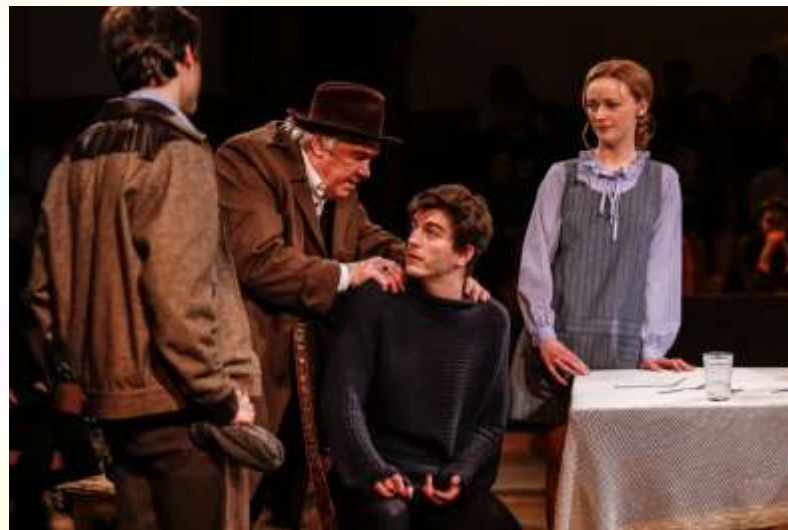
Постановка пьесы «Старший сын»