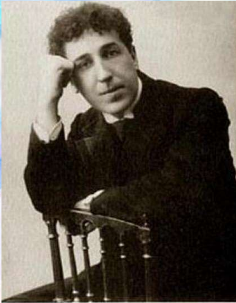
Игорь-Северянин. Москва, 1915 год.

В 1913 году увидел свет сборник Северянина «Громокипящий кубок», принёсший поэту славу. Игорь стал ездить по стране с поэтическими вечерами, которые пользовались невероятным успехом, ведь он, помимо таланта, обладал ещё непревзойдённым исполнительским даром.