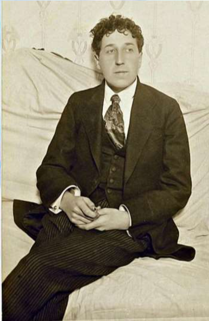
Игорь-Северянин. 1910-е годы

Творческие люди часто черпают вдохновение в любовных переживаниях.