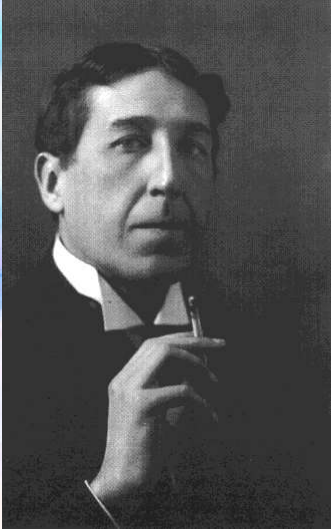
Игорь-Северянин. 1921 год.

В 1912 году Игорь впервые побывал в эстонском посёлке Тойла, где ему очень понравилось, потом он проводил там почти каждое лето.