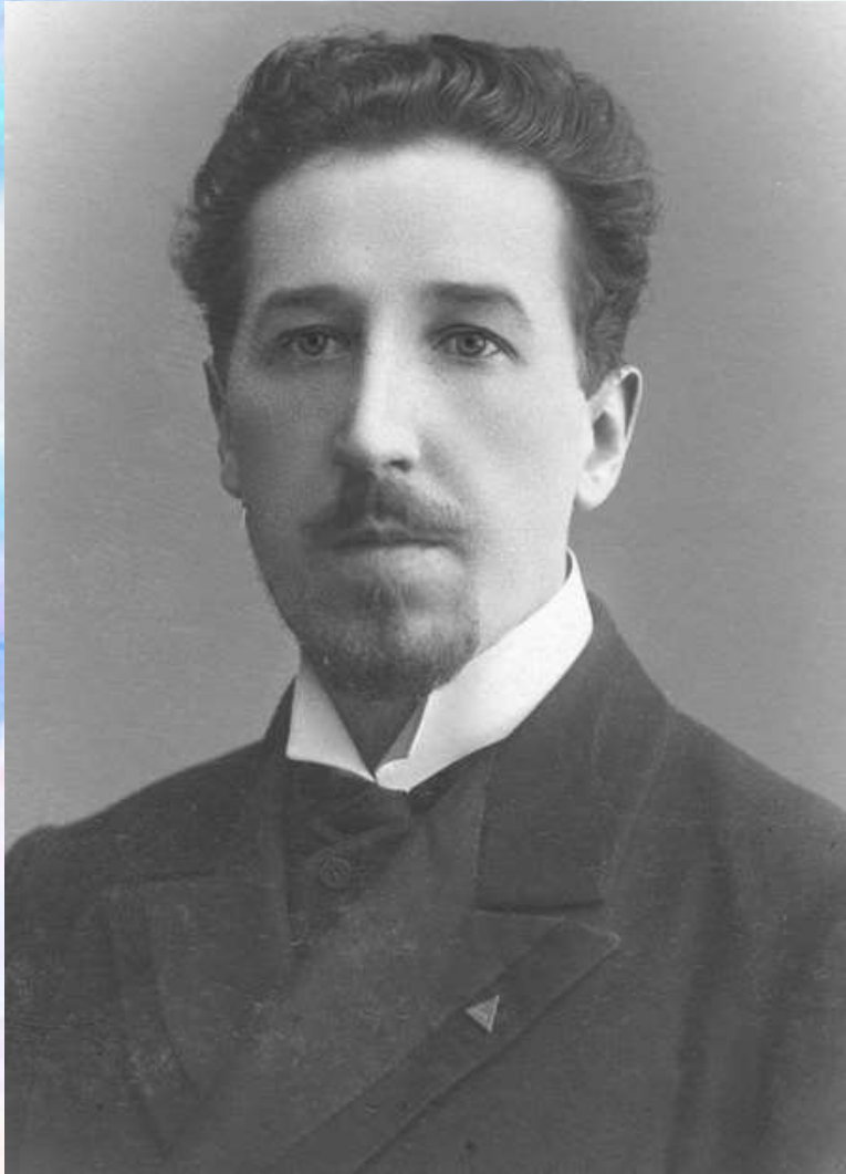
Игорь-Северянин в 1912 году.

В литературе первого десятилетия XX века главенствовал символизм, однако к 1910 году направление уже находилось в кризисном состоянии.