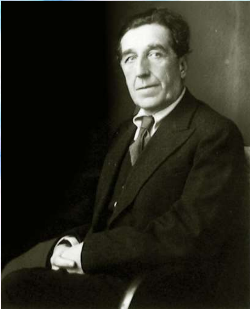
Игорь-Северянин. 1939 год

После оккупации Эстонии немецкими войсками поэту пришлось переехать в Таллин.