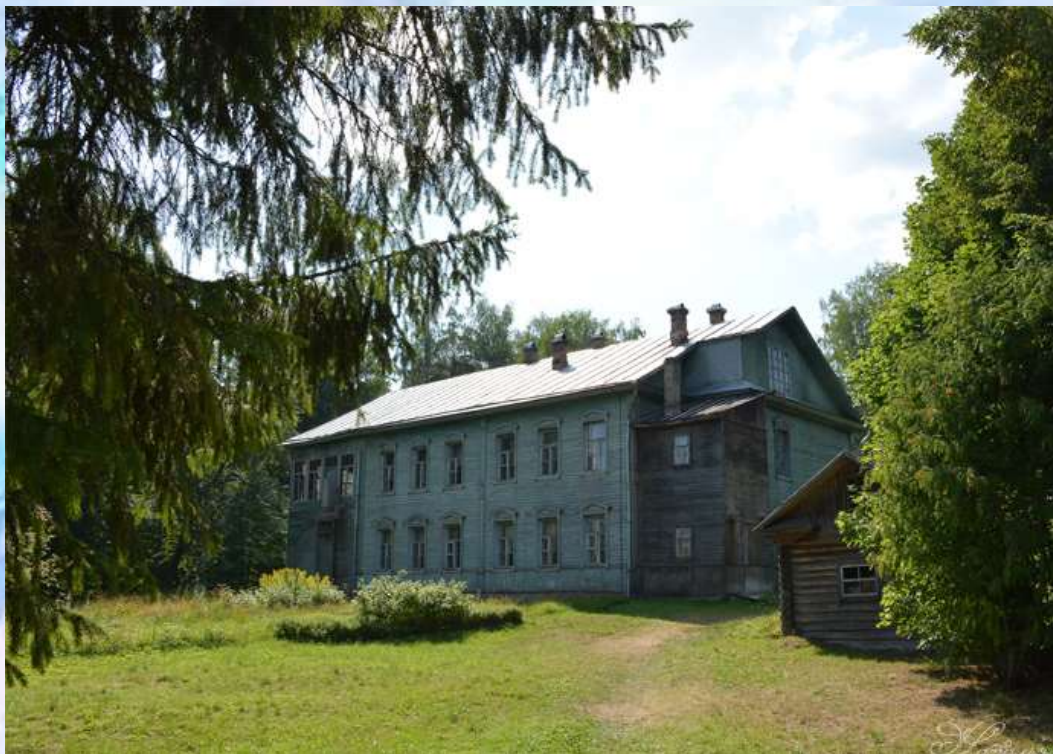
Усадьба Лотарёвых. Город Череповец

В Череповце Игорь отучился 4 класса в реальном училище.