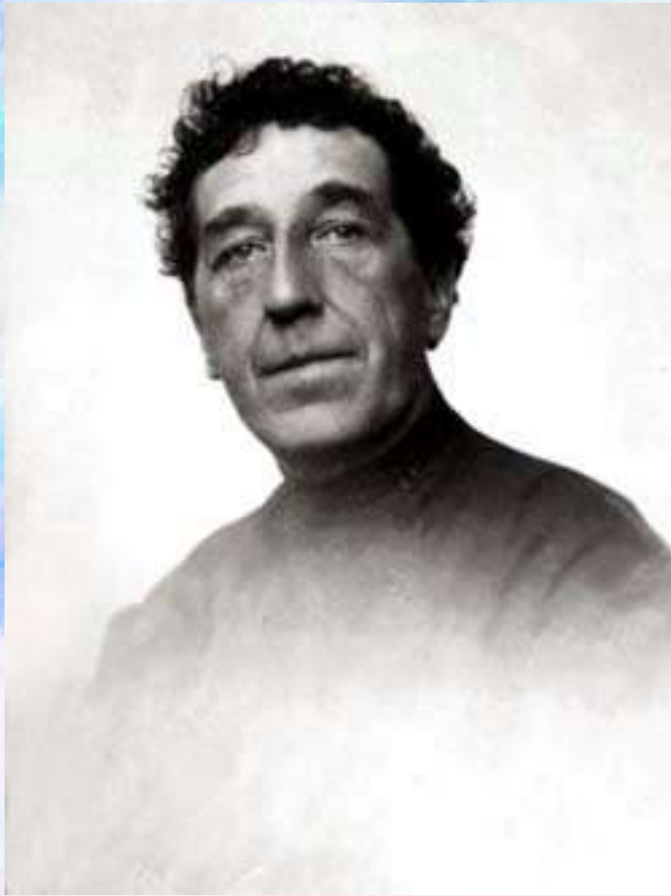
Игорь-Северянин. Рига, 1930 год.