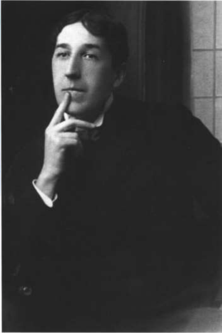
Игорь-Северянин. 1913 год

Вернувшись в Петербург Игорь жил вместе с матерью в доме сводной сестры поэта, Зои Домонтович.