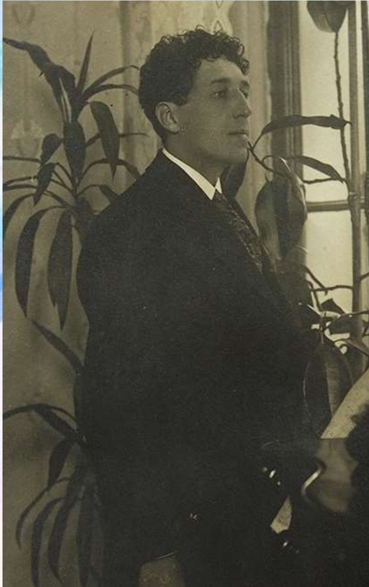
Игорь Северянин. 1915 г.

Именно Фофанов посоветовал своему молодому другу взять творческий псевдоним.