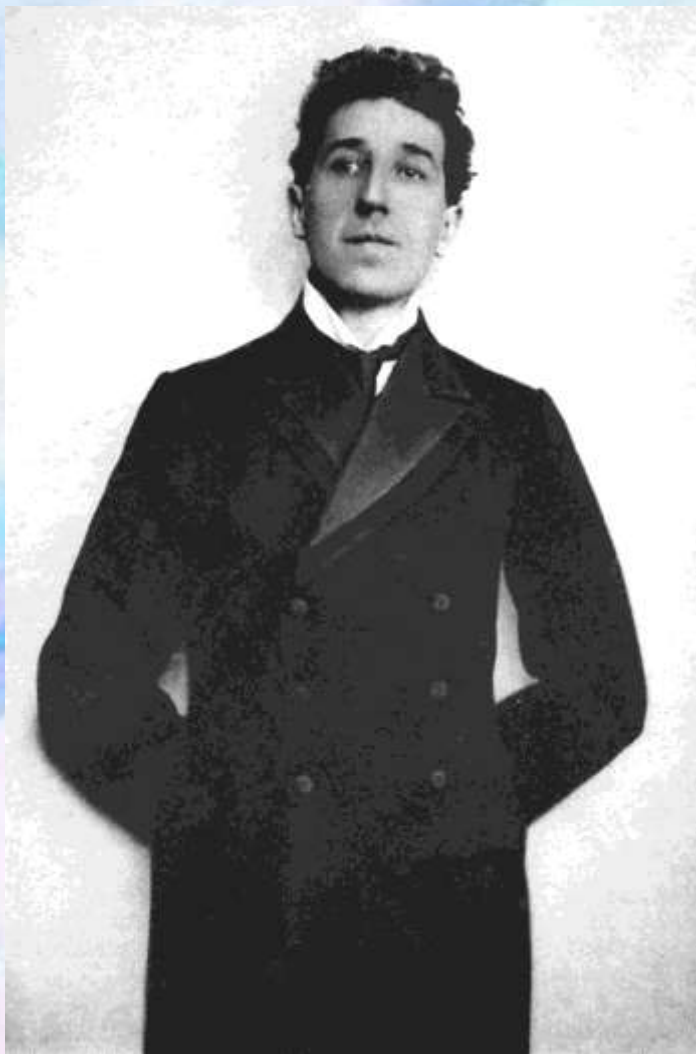
Игорь-Северянин. 1916 год