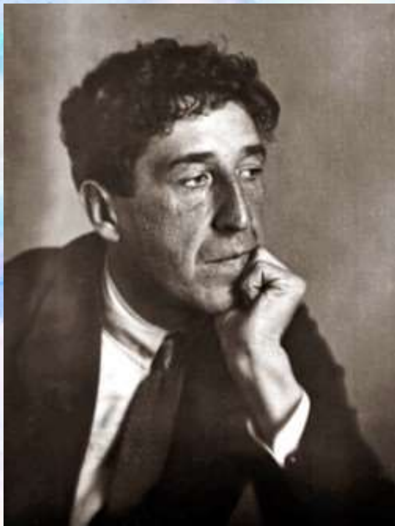
Игорь-Северянин. Тарту, 1923 год.

После победы в поэтическом состязании Северянин вернулся в Эстонию к жене и матери. Но в марте 1918 года был заключен Брестский мир, маленький прибалтийский посёлок Тойла оккупировали немцы, Северянин оказался отрезанным от России. Так началась для него вынужденная эмиграция.