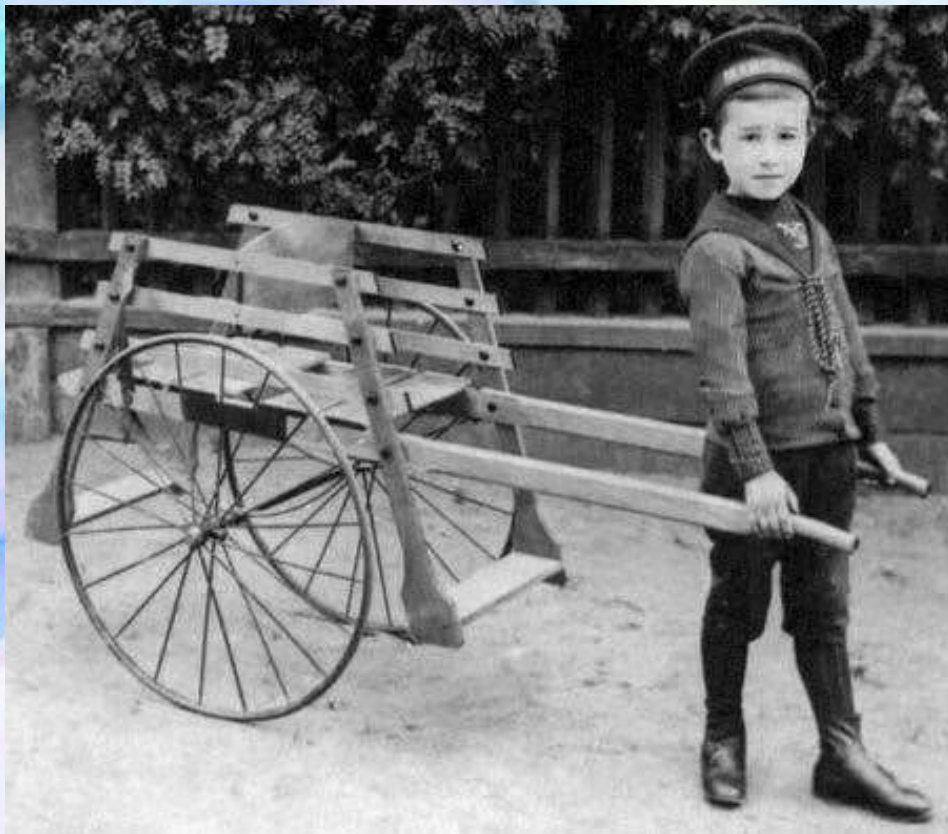
Игорь Северянин 1890-е годы