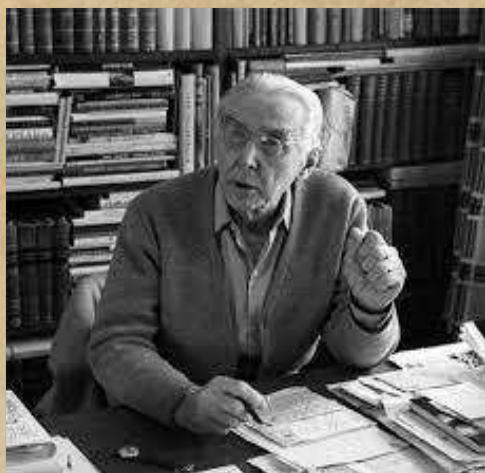
К. А. Федин

В 1947 году Федин утвержден профессором Литературного института им. А. М. Горького по кафедре «Советская литература и творчество».