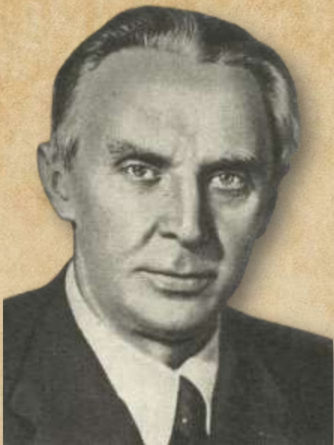
Константин Александрович Федин (1892 – 1977)

Константин Александрович Федин – русский советский писатель и журналист, специальный корреспондент. Первый секретарь и председатель правления Союза писателей СССР. Член АН СССР и Немецкой академии искусств (ГДР). Герой Социалистического Труда.