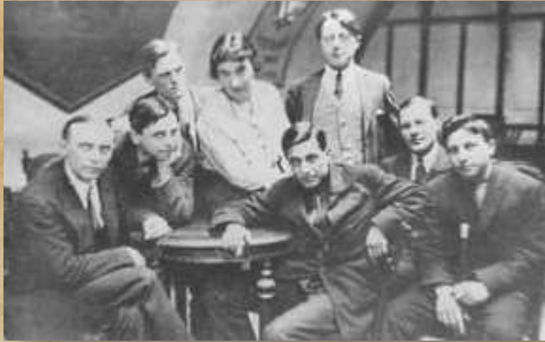
Константин Александрович Федин – Челябинская областная универсальная научная библиотека

В августе 1934 года Федин выступает на Первом Всесоюзном съезде писателей и избирается в состав правления Союза. В 1939 году Константин Александрович награжден орденом Трудового Красного Знамени. В 1941 году появляется журнальная публикация книги «Горький среди нас», а в 1944 году выходит отдельное издание.