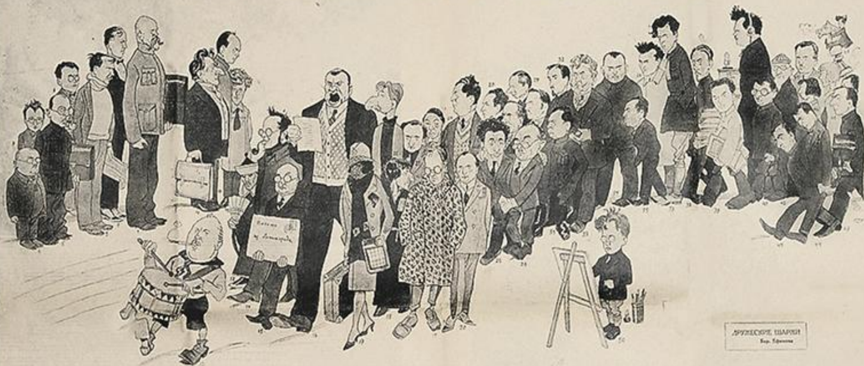
БОРИСОВЕ ЕФИМОВЕ Бор. Ефимов