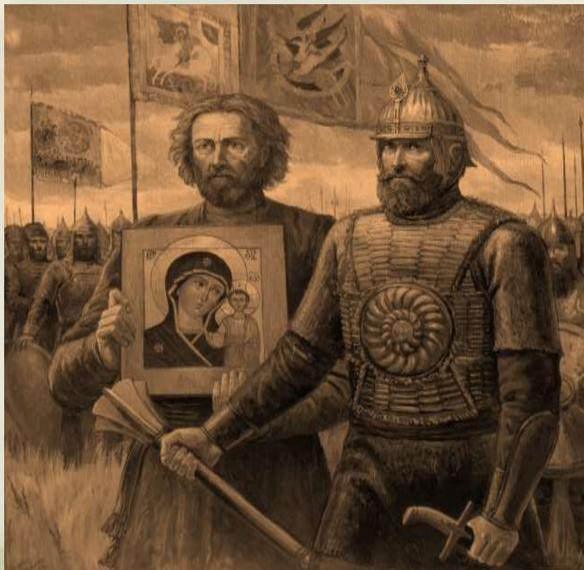
«Гражданин Кузьма Минин и князь Дмитрий Пожарский. 1612 год», художник Ф. Москвитин.

Праздник учреждён Федеральным Законом «О внесении изменений в статью 1 Федерального закона "О днях воинской славы (победных днях) России», который вступил в силу 1 января 2005 года.