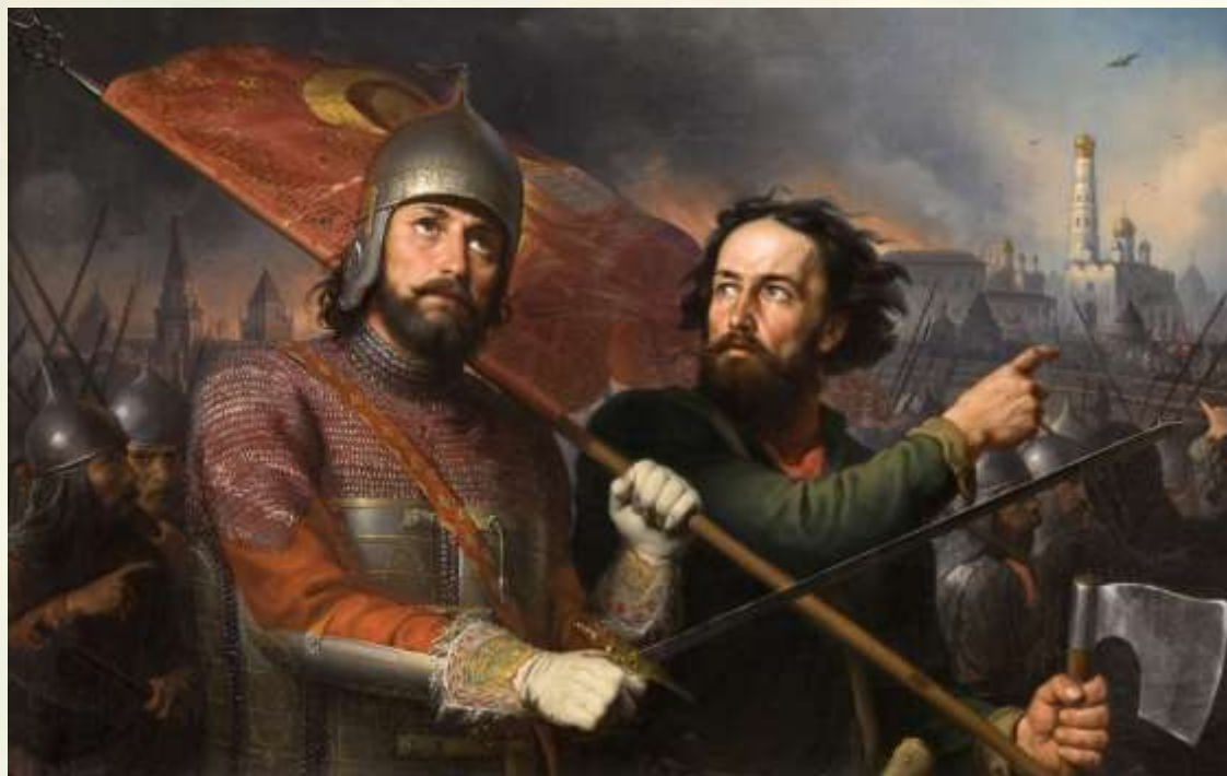
«Минин и Пожарский», художник М. И. Скотти, 1850 год. Нижегородский государственный художественный музей.