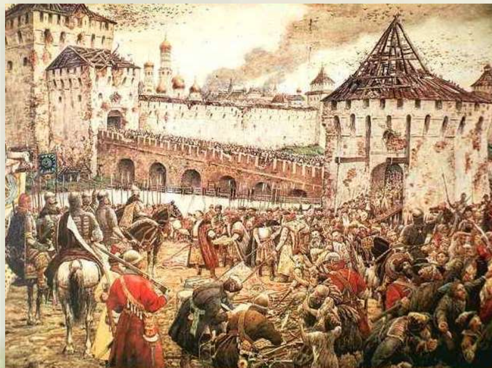
«Изгнание польских интервентов из московского Кремля в 1612 году», художник Э. Лисснер

Пожарский с полком встал на Каменном мосту у Троицких ворот Кремля, чтобы встретить боярские семьи и защитить их от казаков. 26 октября (5 ноября) 1612 года поляки сдались и покинули Кремль.