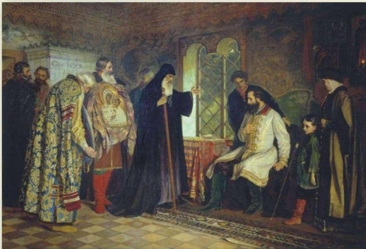
«Нижегородские послы у князя Дмитрия Пожарского», художник Василий Савинский, 1882 год.