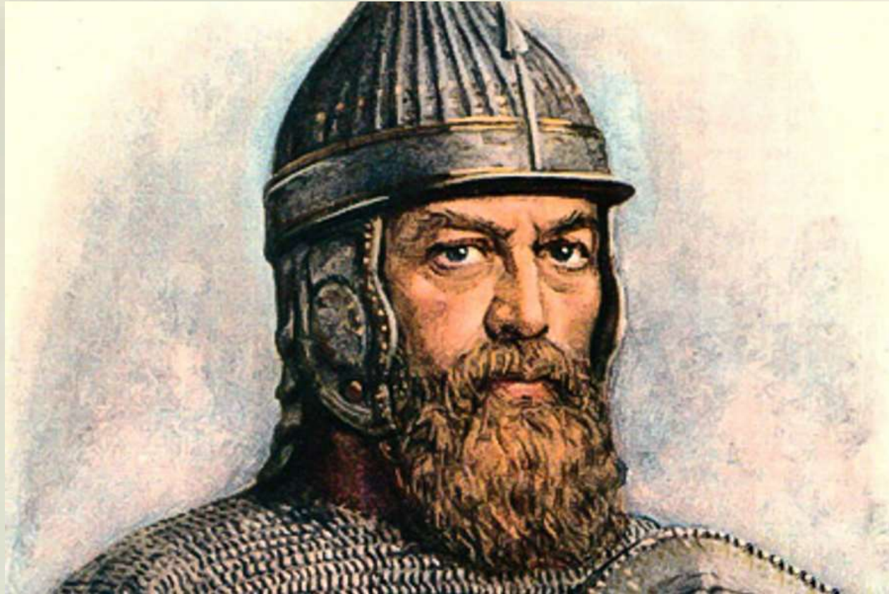
Князь Дмитрий Михайлович Пожарский

Так во главе второго земского ополчения стали два человека, избранные народом и облечённые его полным доверием.