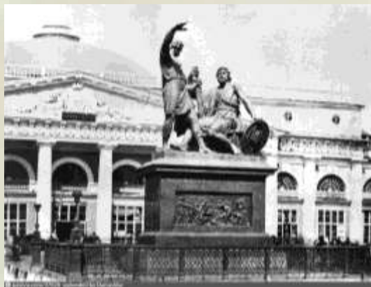
Памятник Минину и Пожарскому в Москве на Красной площади

Ежегодно в День народного единства люди приносят к нему цветы, отдавая дань памяти героям, бившимся за освобождение своей Родины. 4 ноября 2005 года копию московского памятника установили в Нижнем Новгороде.