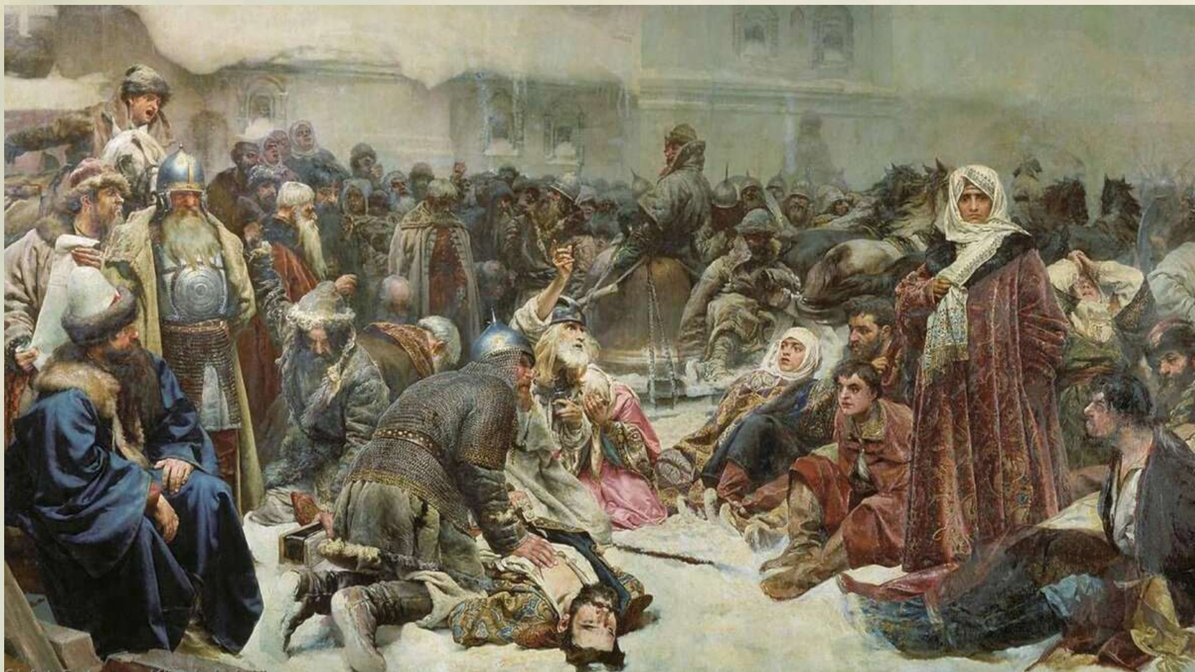
«В годы смуты», художник С. Иванов.

После смерти царя Ивана Грозного в 1543 году в Московском государстве настал глубокий кризис. Династия Рюриковичей прервана. Единое русское государство распалось, появились многочисленные самозванцы. Повсеместные грабежи, разбой, воровство, мздоимство, повальное пьянство поразили страну.