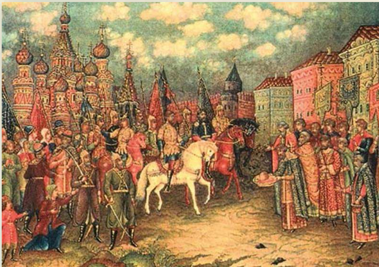
«Вступление князя Пожарского и Минина в Кремль 25 октября 1612 года», художник И. Н. Морозов.

27 октября (6 ноября) 1612 г. был назначен торжественный вход в Кремль войск князей Пожарского и Трубецкого. Когда войска собрались у Лобного места, архимандрит Троице-Сергиевого монастыря Дионисий совершил торжественный молебен в честь победы ополченцев. После чего под звон колоколов победители в сопровождении народа вступили в Кремль со знамёнами и хоругвями.