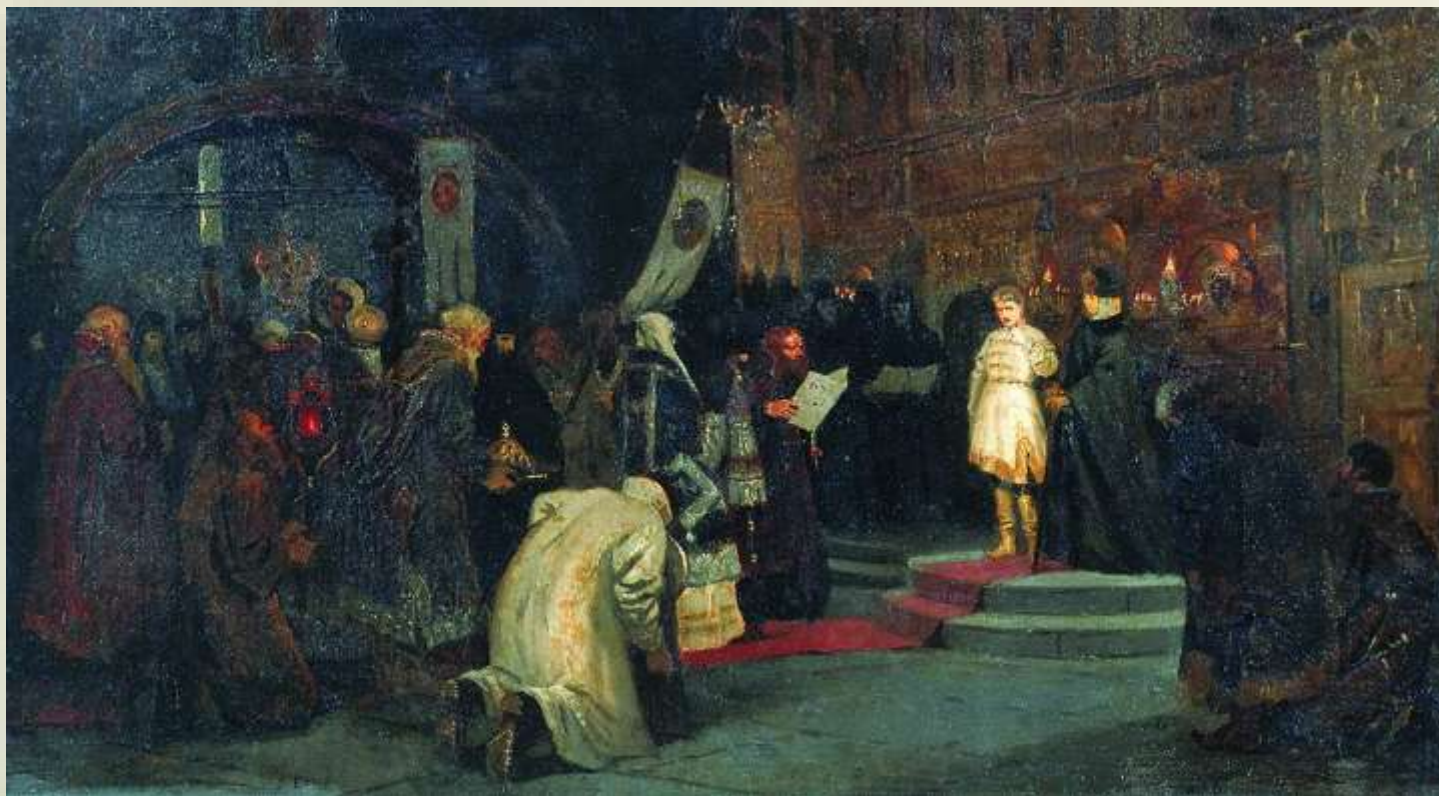
«Призвание М. Ф. Романова на царство», художник М. В. Нестеров.

После освобождения Москвы был созван Земский собор для избрания нового царя. В нём принимали участие и крестьяне, и дворяне, представители всевозможных сословий. Съехались представители всех городов России. Многие историки характеризуют Земский собор 1613 года как поистине всенародное и примиряющее жителей страны событие. Было выдвинуто более десяти кандидатур. «Иностранных принцев» в качестве претендентов на русский престол уже не рассматривали. 7 февраля 1613 года (по старому стилю) царём был избран Михаил Федорович Романов, основавший новую царскую династию России.