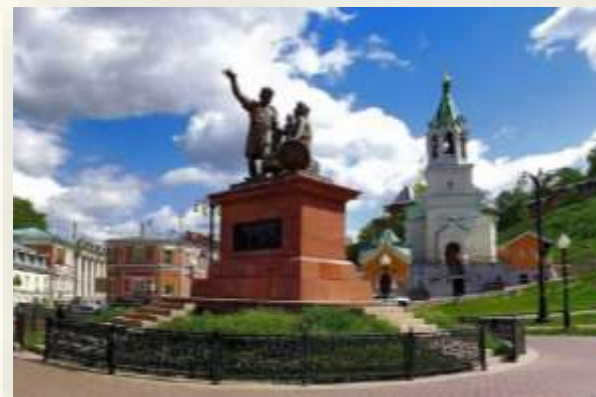
Памятник Минину и Пожарскому в Нижнем Новгороде