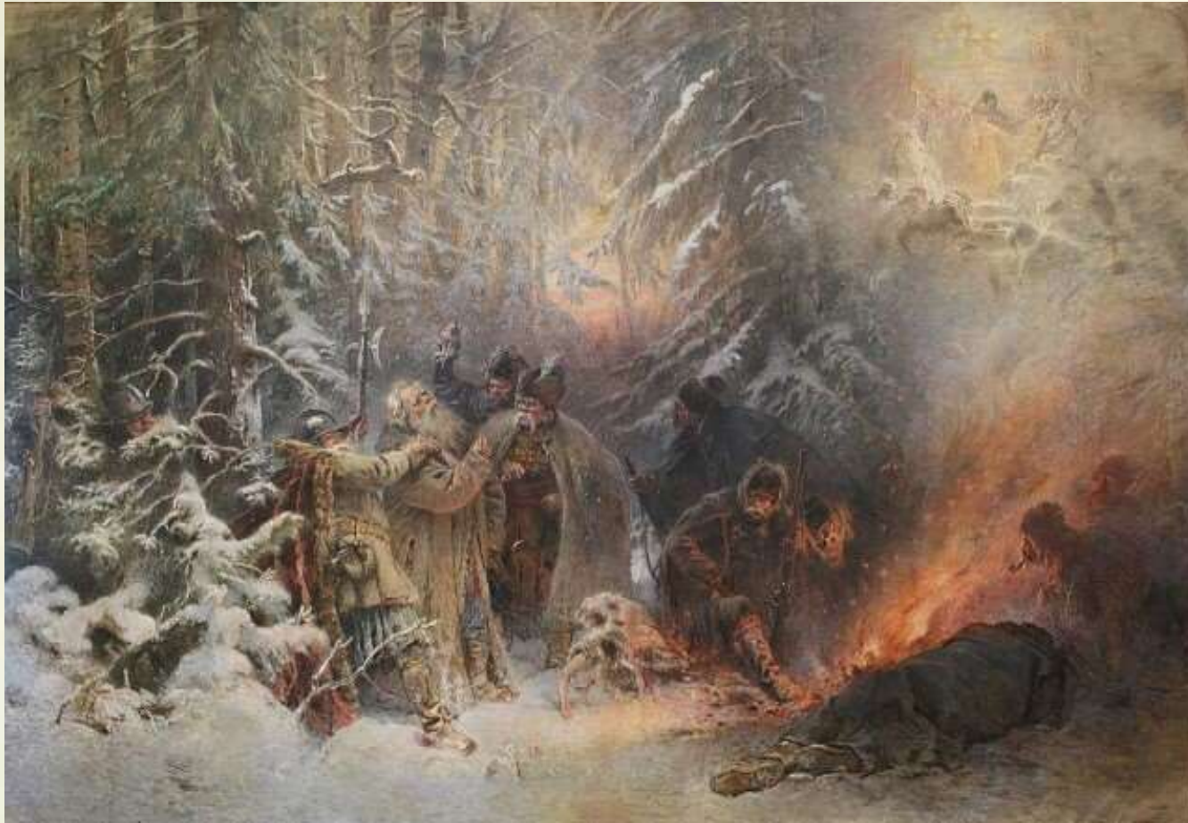
«Иван Сусанин», художник К. Е. Маковский, 1914 год.

Поляки пытались помешать новому царю прибыть в Москву. Небольшой их отряд отправился в Ипатьевский монастырь убить Михаила, но по дороге заблудился, поскольку крестьянин Иван Сусанин, согласившись показать дорогу, завел его в дремучий лес.