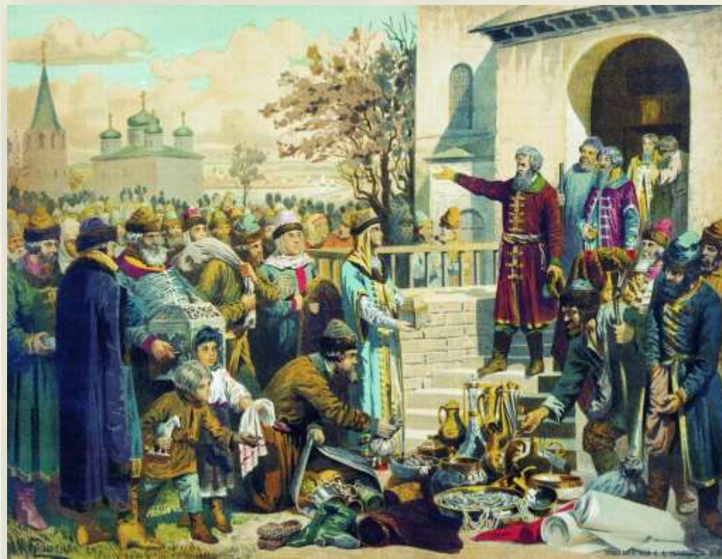
«Воззвание Козьмы Минина к нижегородцам 1611 г.», художник Алексей Кившенко.

В сентябре 1611 года нижегородский земский староста Кузьма Минин, обратился к горожанам с призывом создать народное ополчение. Он произнёс свою знаменитую речь на городской сходке: «Православные люди, похотим помочь Московскому государству, не пожалеем животов наших, да не токмо животов – дворы свои продадим, жён, детей заложим и будем бить челом, чтобы кто-нибудь стал у нас начальником. И какая хвала будет всем нам от Русской земли, что от такого малого города, как наш, произойдёт такое великое дело».