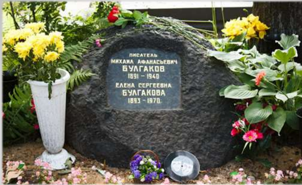
Могила М. А. Булгакова на Новодевичьем кладбище

М. А. Булгаков много лет страдал от тяжёлого наследственного заболевания почек, которое обострилось к сентябрю 1939 г. В феврале 1940 г. он продиктовал последние правки к роману «Мастер и Маргарита». 10 марта 1940 г. М. А. Булгаков скончался. Его тело было кремировано, а прах захоронен на Новодевичьем кладбище в Москве. Надгробием на могиле Булгакова стал камень с могилы Н. В. Гоголя, который был любимым писателем Михаила Афанасьевича. В 1970 г. под этим же камнем упокоилась Елена Сергеевна Булгакова.