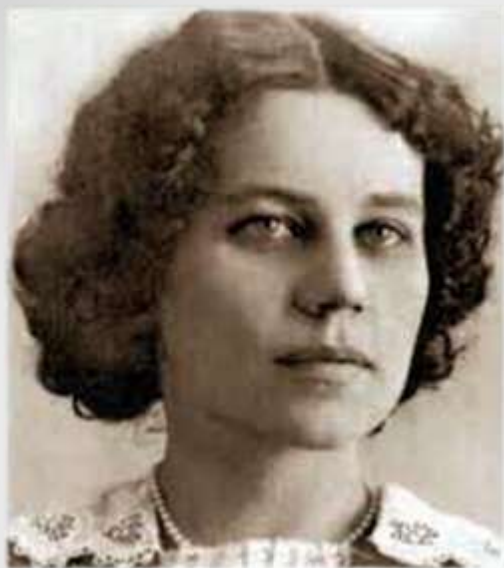
Татьяна Лаппа – первая жена Михаила Булгакова

В июле 1909 г. Булгаков поступает на медицинский факультет Киевского университета.