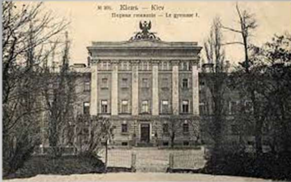
Первая Киевская мужская гимназия

В 1907 году от болезни умер отец Михаила Булгакова. Мать осталась одна с семью детьми. Ежемесячной пенсии, которую выплачивала Киевская духовная академия, не хватало. Тогда Варвара Михайловна стала преподавать на вечерних женских курсах, а Михаил начал искать работу, чтобы помочь матери: он занимался репетиторством, а летом служил кондуктором на железной дороге. Несмотря на денежные трудности, все дети продолжали учиться в престижных гимназиях Киева.