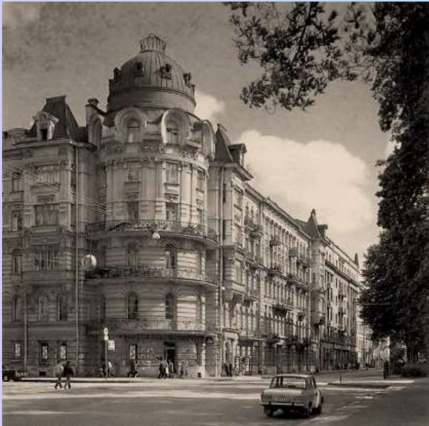
«Башня» на Таврической

В 1905 году поселился в Петербурге. Квартира на Таврической улице в угловой башне дома № 25 на последнем этаже получила название «башня». Там проходили знаменитые Литературные «среды», которые привлекали писателей. Здесь бывали: Александр Блок, Андрей Белый, супруги Дмитрий Мережковский и Зинаида Гиппиус, Николай Гумилёв, Анна Ахматова, Константин Сомов и другие.