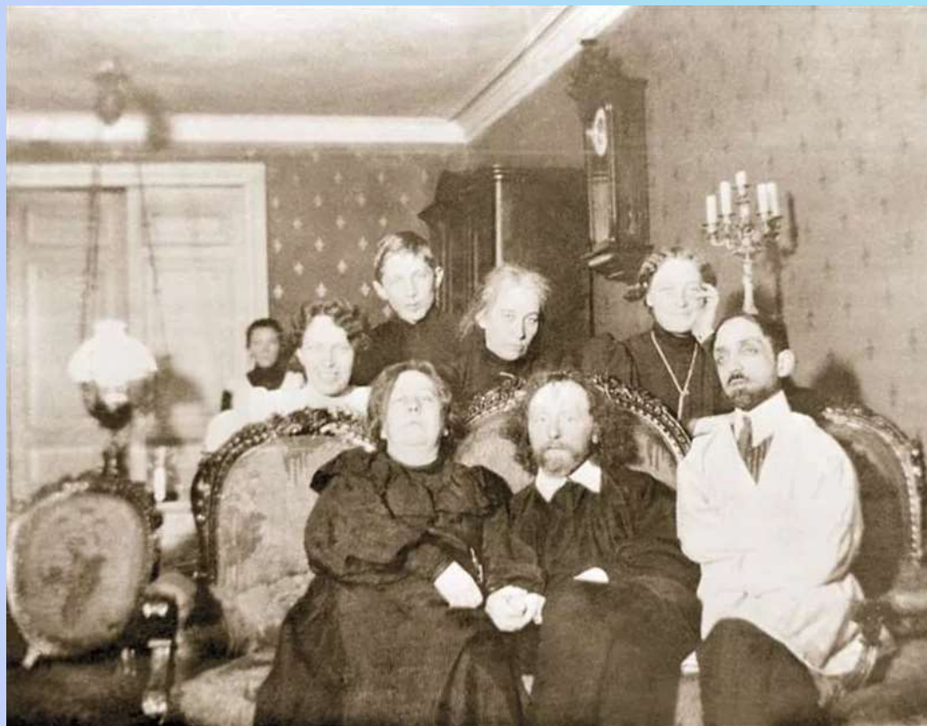
1909 год. В первом ряду Л. Д. Зиновьева-Аннибал, В.Иванов, М. Кузьмин

В 1907 году Иванов организовал издательство «Оры» — в противовес издательству московских символистов «Скорпион».