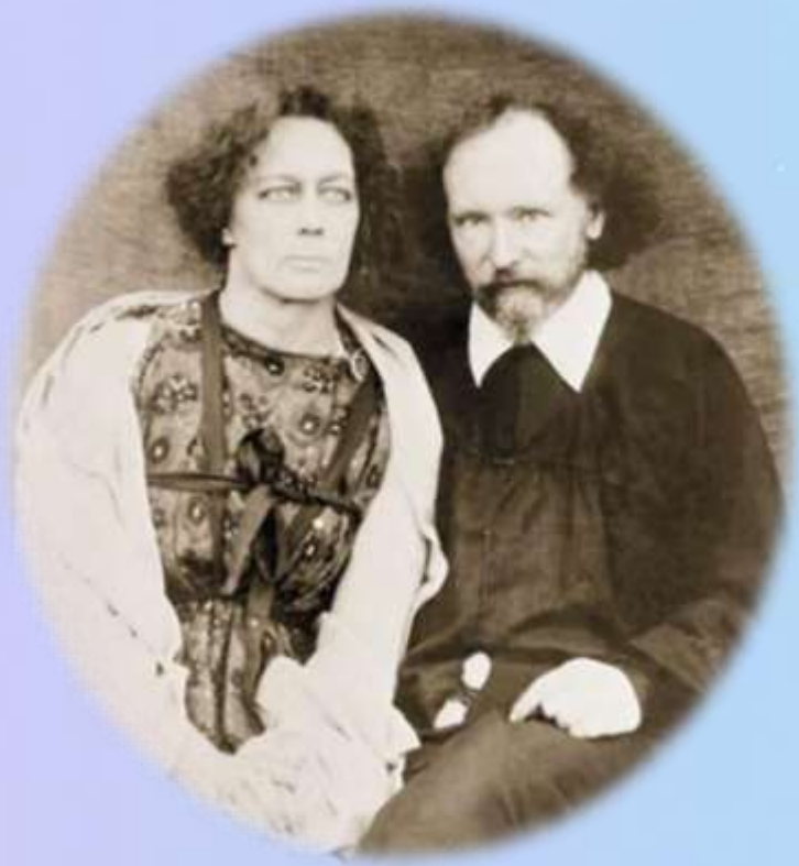
Вячеслав Иванов с женой Лидией Дмитриевной Зиновьевой- Аннибал.