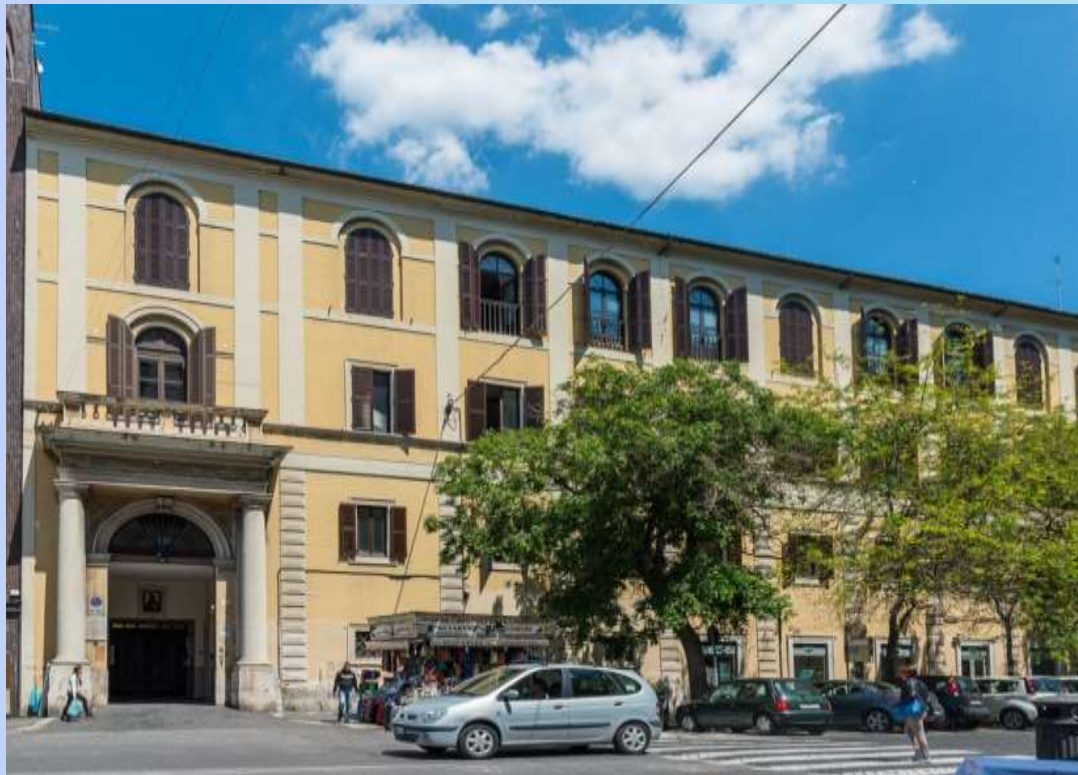
Здание папского восточного института

В Риме папа Пий XI поручил Вячеславу Ивановичу кафедру русского языка и литературы и старославянского языка при папском Восточном институте.