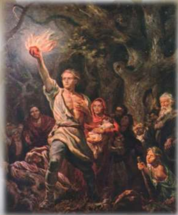
Легенда о Данко. Художник И.М. Тоидзе

Успеху (жизненному, личному, социальному, учебному, спортивному, трудовому, финансовому и любому другому) всегда сопутствует книга. Специалисты Центральной библиотеки Крыма готовы стать помощником в поиске той самой, главной Книги для Вас.