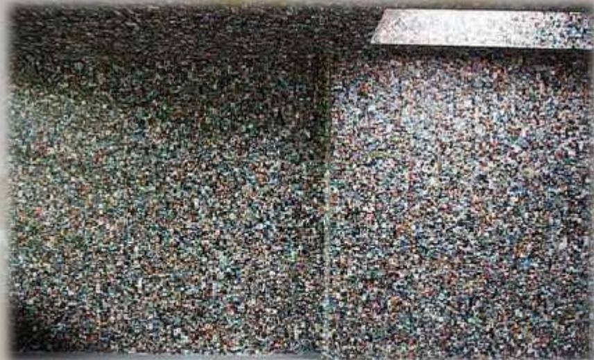
Символ избытка информации. Фотографии из соцсети

В результате технического прогресса человечество стало испытывать переизбыток информации, но в это же время не у всех есть компьютер и выход в интернет. В информационно пресыщенном XXI веке библиотека и библиотекарь являются ориентиром и навигатором в потоке информации для всех слоев общества.