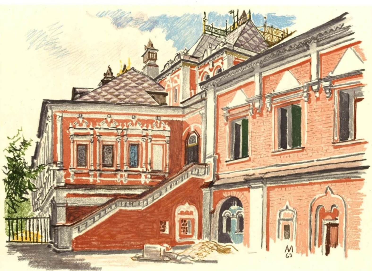
Москва. Юсуповский дворец (первоначально палаты боярина Волкова). Конец XVII в.