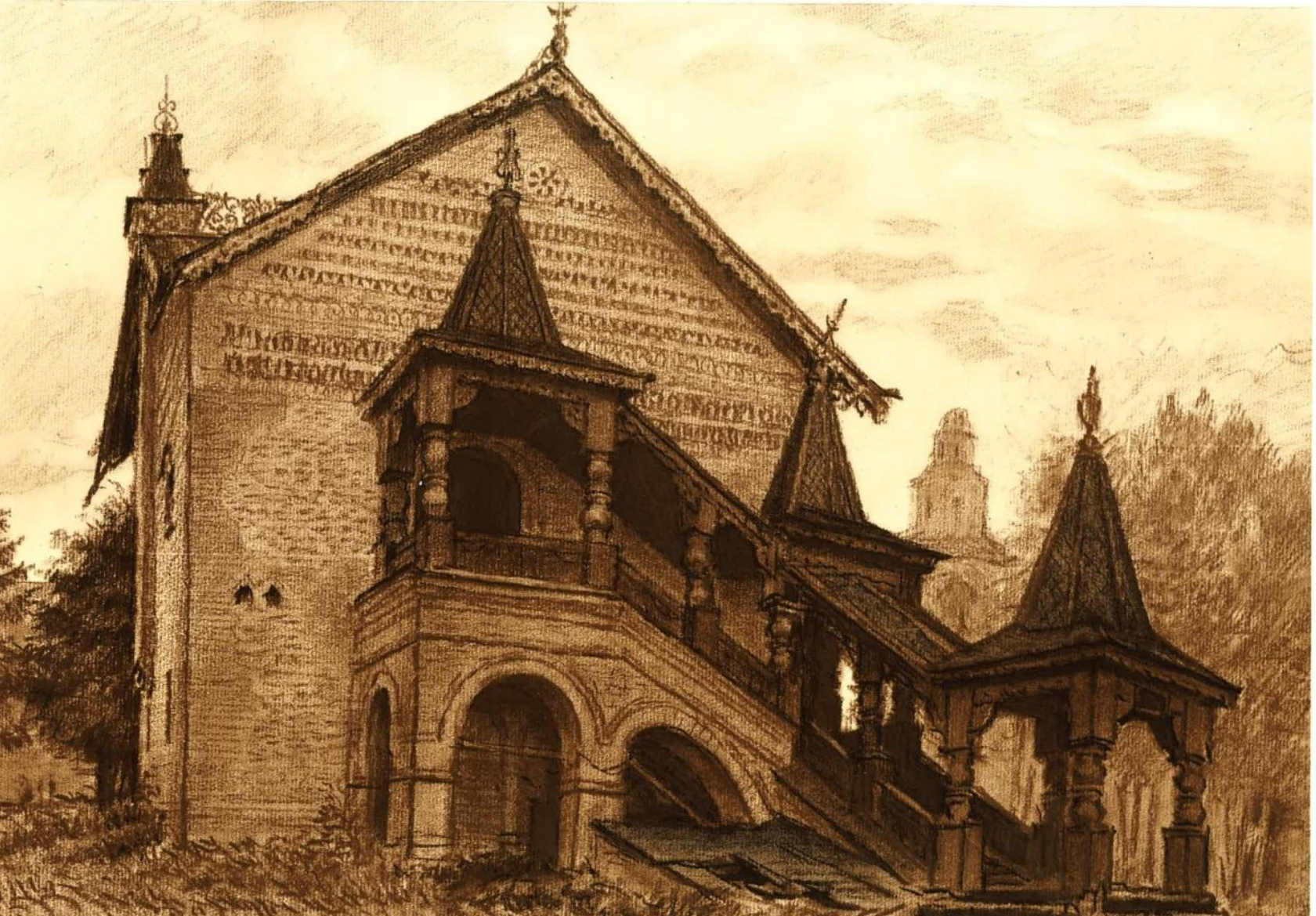
Углич. Каменные палаты (Дворец царевича Димитрия). 1482