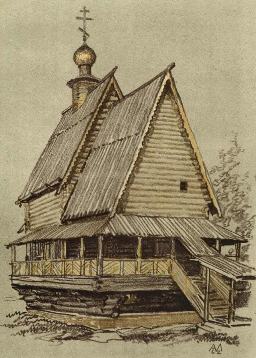
Суздаль. Церковь Николы из села Глотова. 1766