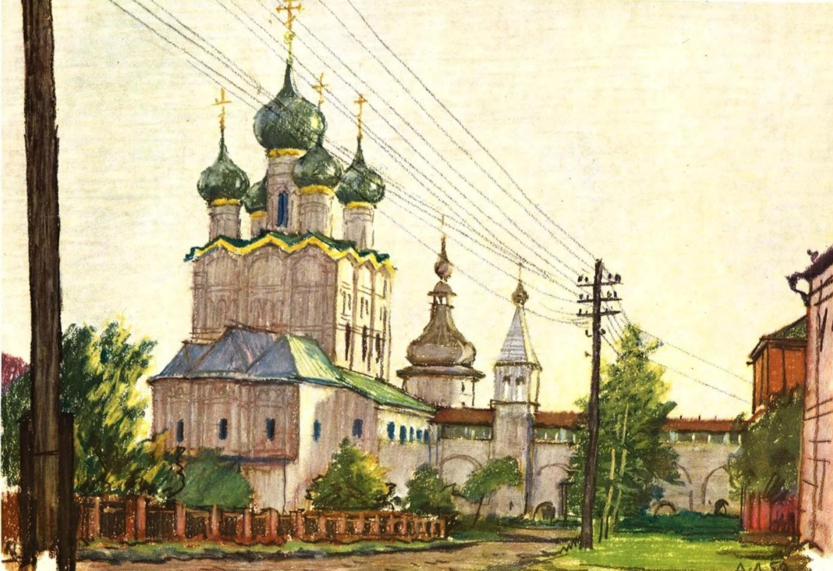
Ростов Великий. Церковь Иоана Богослова “на воротах” 1683