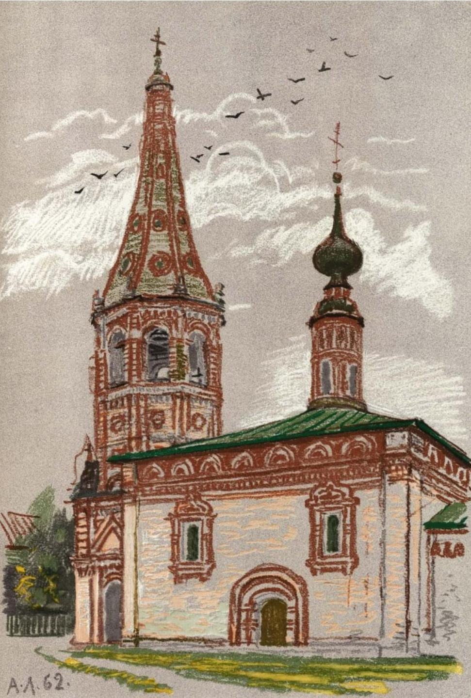
Суздаль. Никольская церковь. 1720 – 1739