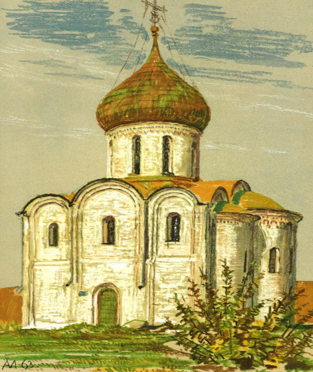
Переславль-Залесский. Свято-Преображенский собор. 1152 – 1157.