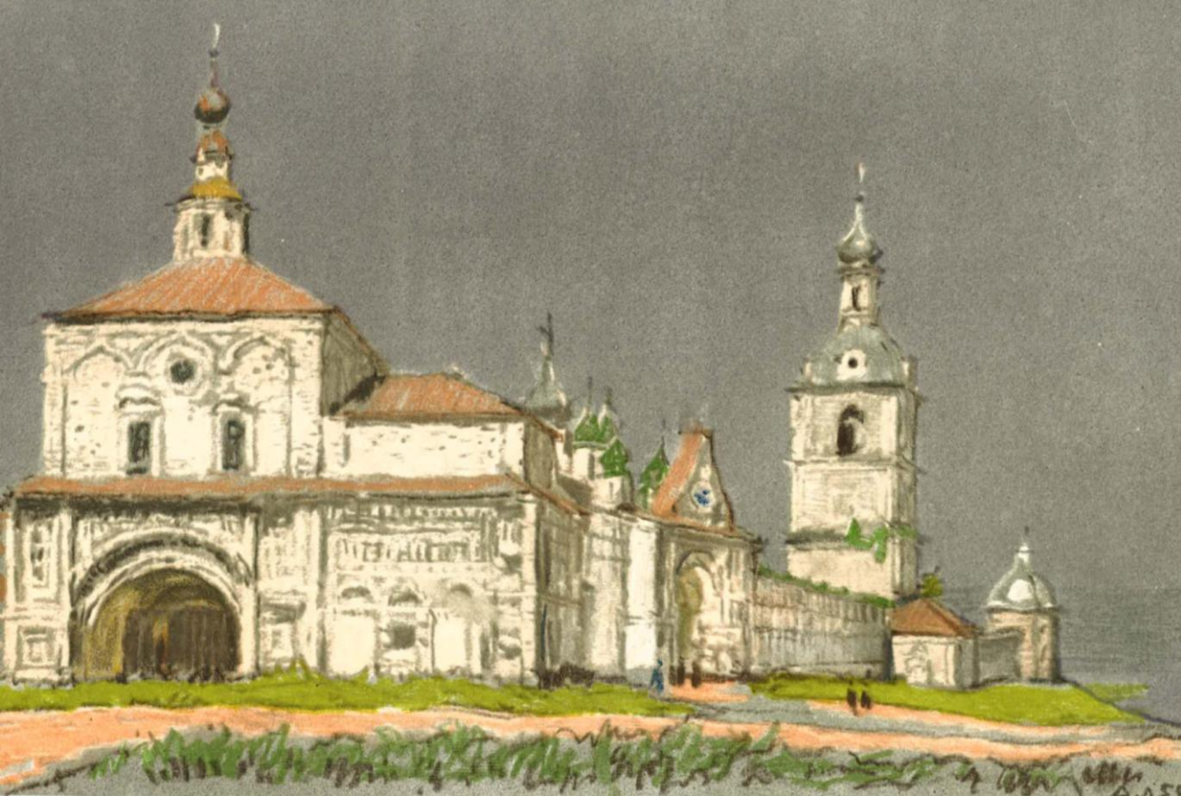
Переславль-Залесский. Проездные ворота и стены Горицкого монастыря. 1630-е годы