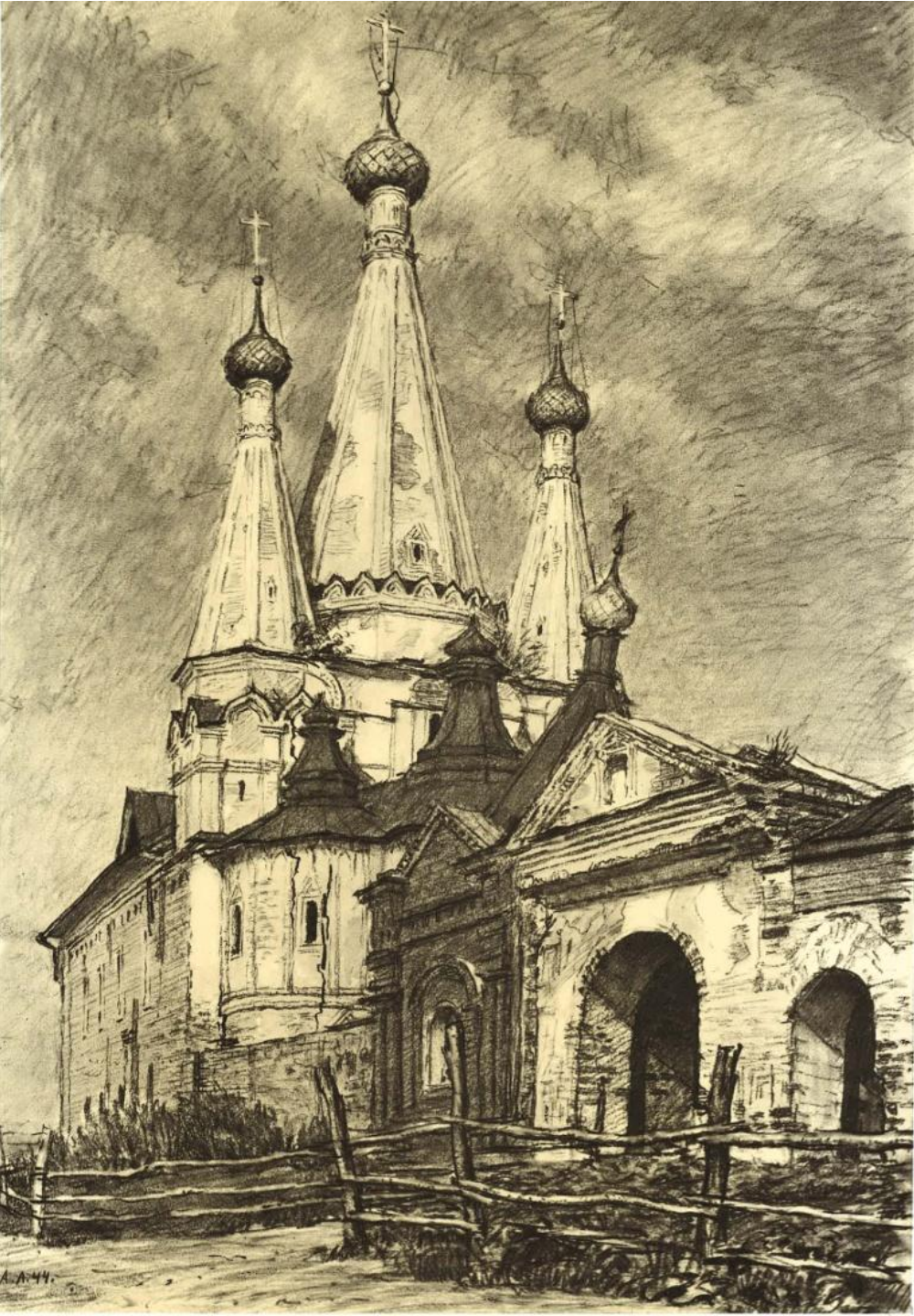
Алексеевский монастырь в Угличе. Успенская (Дивная) церковь. 1628