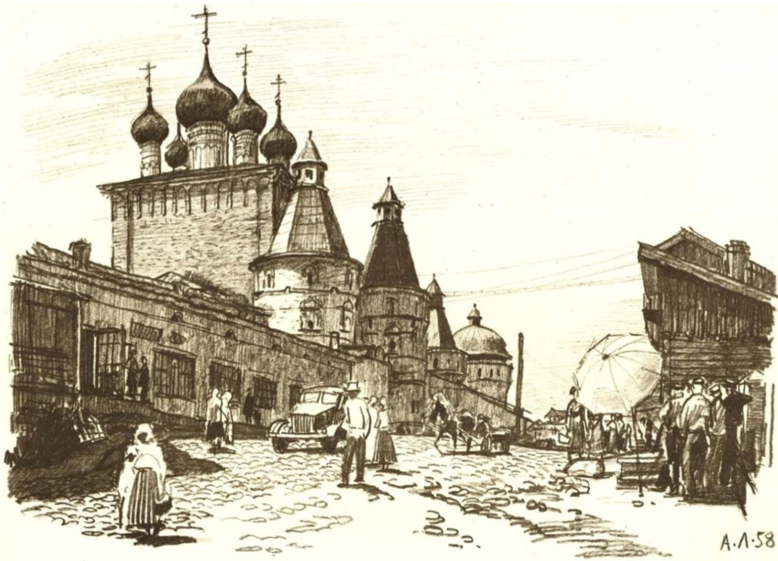
Борисоглебский монастырь близ Ростова Великого. Северные ворота и Сретенская надвратная церковь.