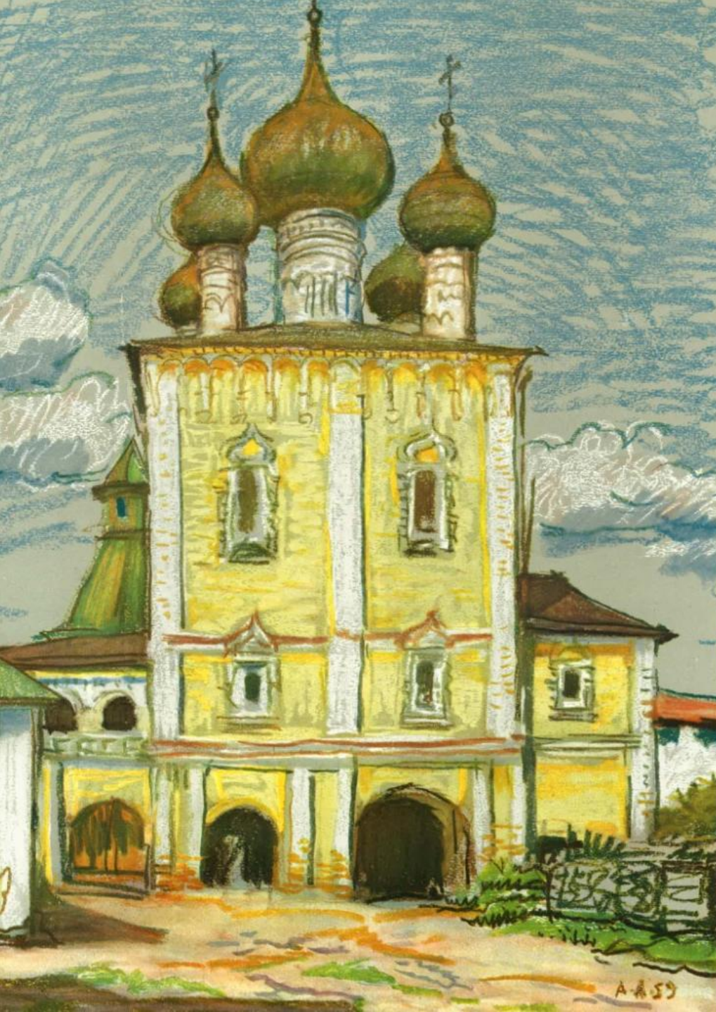
Борисоглебский монастырь близ Ростова Великого. Сретенская надвратная церковь. 1680