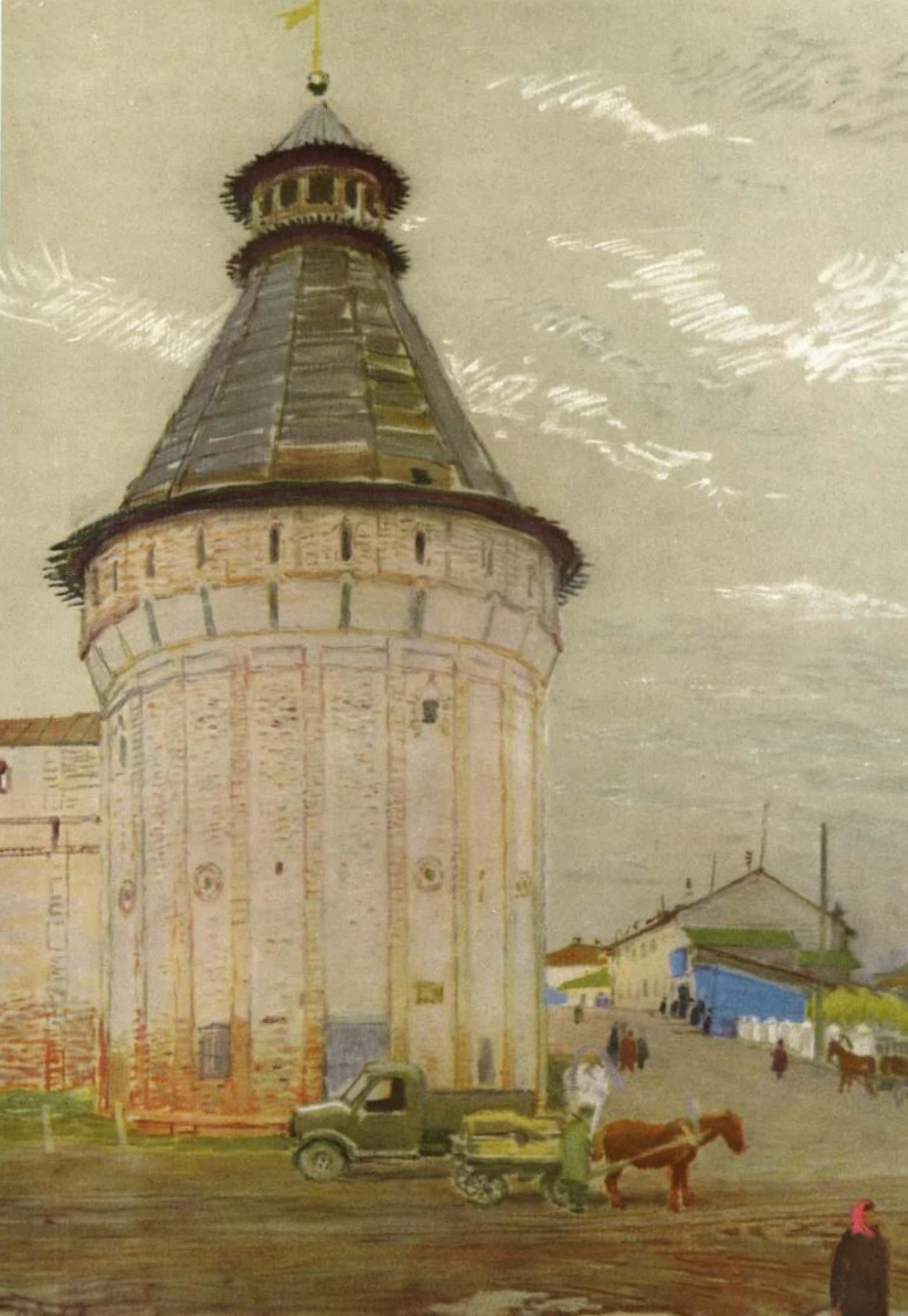
Борисоглебский монастырь близ Ростова Великого. Дозорная башня. Первая половина XVI в.