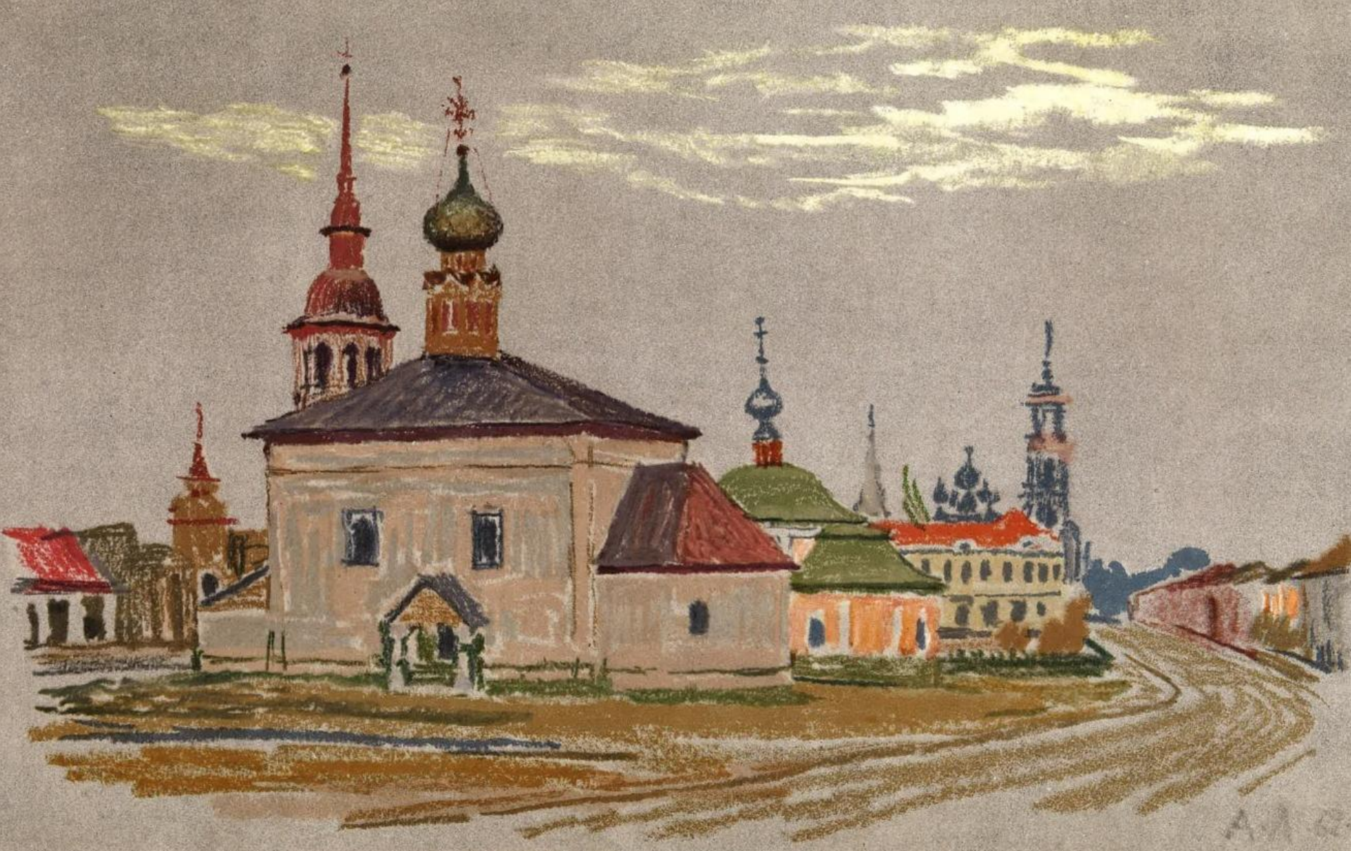
Суздаль. Церковь Воскресения. 1720