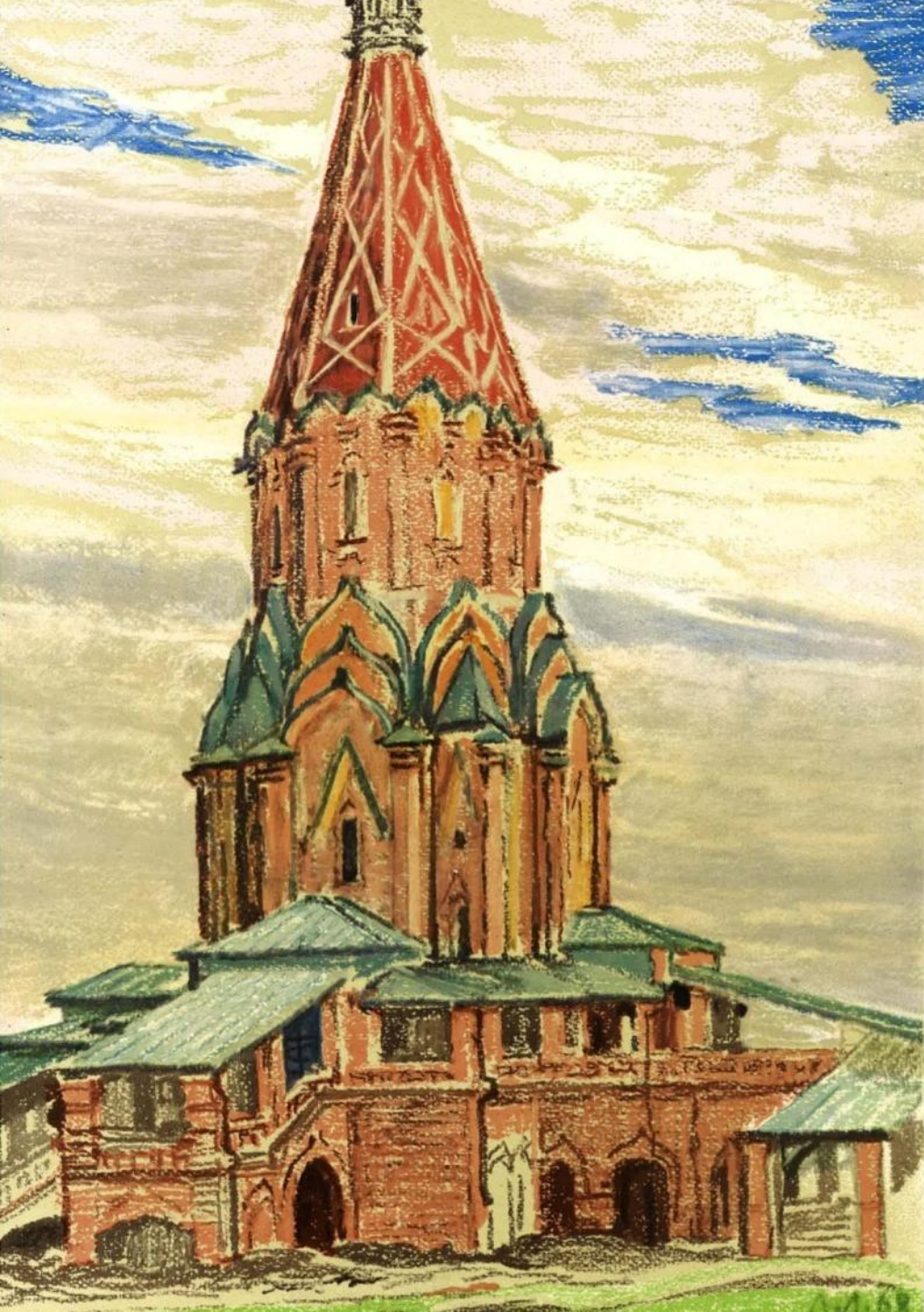
Село Коломенское близ Москвы. Церковь Вознесения. 1532