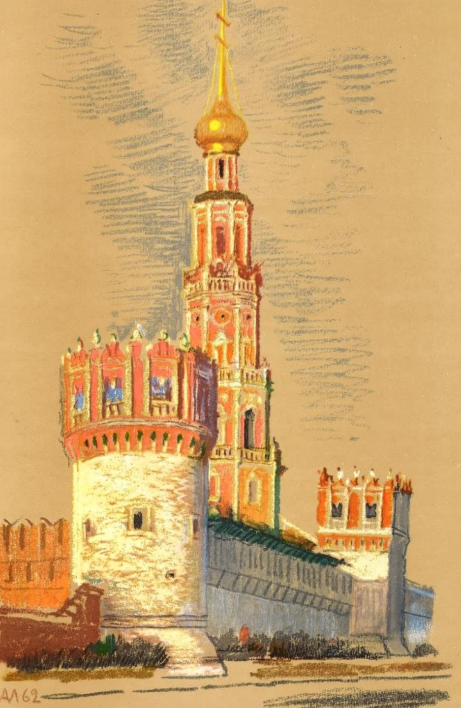
Новодевичий монастырь в Москве. Башни XVI в. (перестроены в 80-х гг. XVII в.). Колокольня.