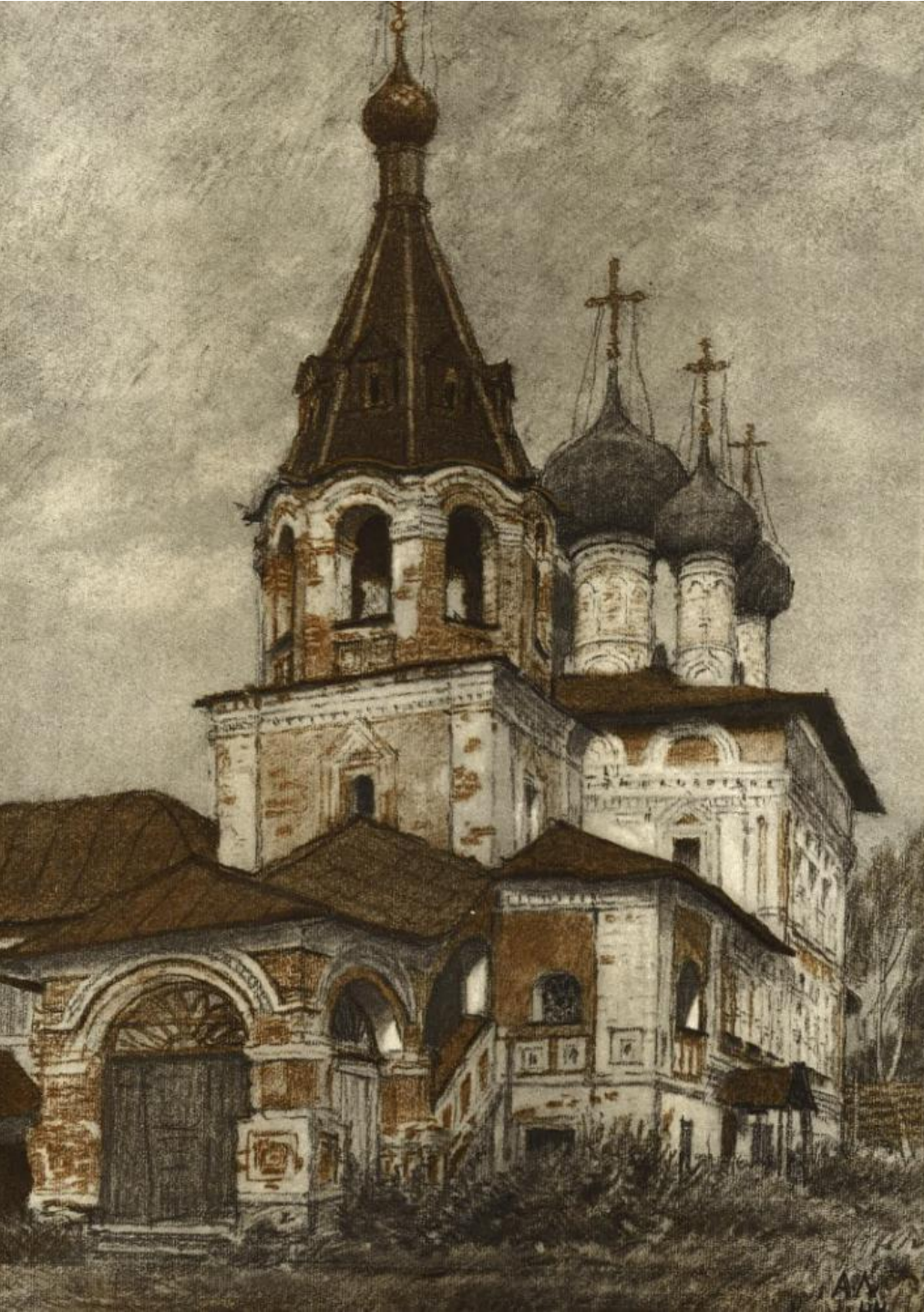
Угличский кремль. Церковь Димитрия «на крови». 1692