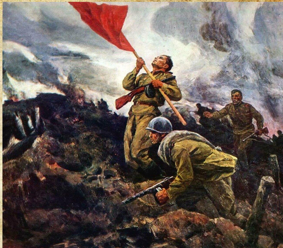
Широков А. «За Родину!»

Великая Отечественная война стала катализатором развития искусства в Советском Союзе. Деятели искусства, как и обычные граждане, были вовлечены в дело защиты страны. У творческих людей была важная задача: поддерживать воевавших на фронте и оставшихся в тылу.