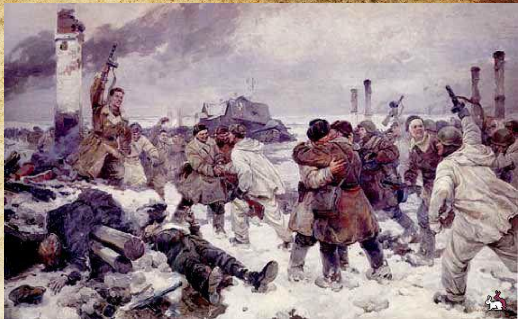
А. А. Казанцев, И. А. Серебряный, В. А. Серов «Прорыв блокады 18 января 1943 года»

Картина изображает радостный момент соединения войск двух фронтов. Она была создана художниками вскоре после прорыва блокады, когда в памяти людей еще свежи были недавние переживания и горести, когда сама земля еще хранила следы ожесточенных сражений.