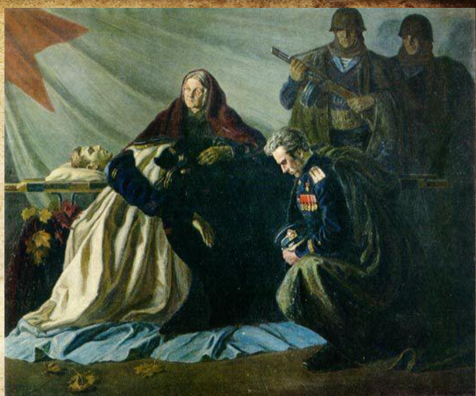
Ф. С. Богородский «Слава павшим героям» 1945 г.

Образ женщины-матери поднимается до символического звучания матери-Родины в картине Ф.С. Богородского «Слава павшим героям».