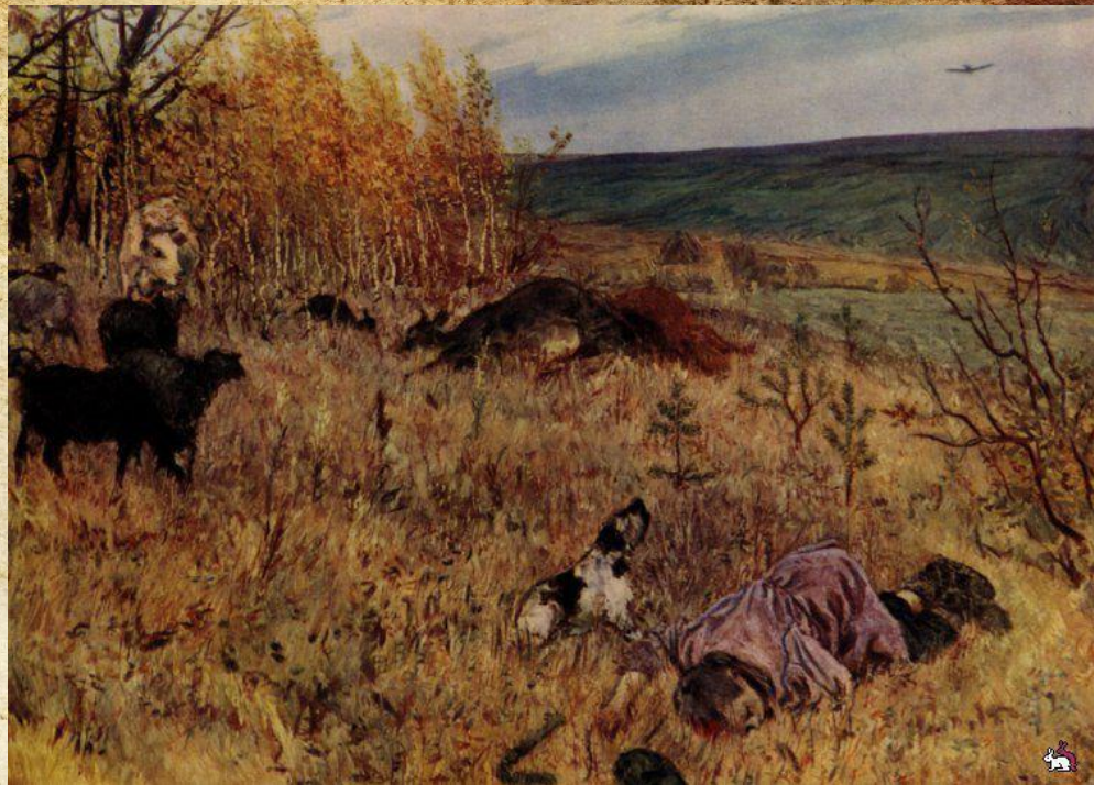
А. А. Пластов «Фашист пролетел» 1942 г.

О зверствах фашистов, об их издевательствах над советскими людьми поведал художники А. А. Пластов в картине «Фашист пролетел».