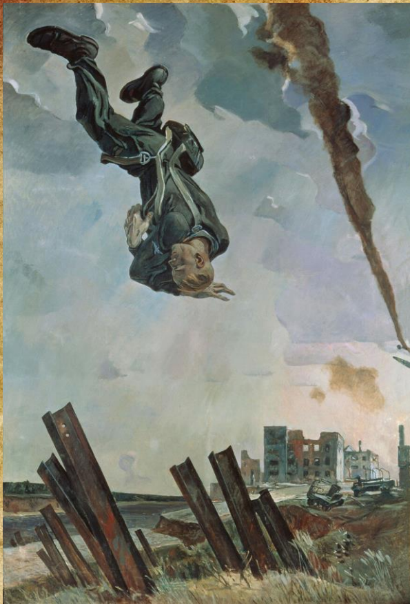
Дейнека А. А. «Сбитый ас» 1943 г.

Основной тематикой живописи тех лет была, разумеется, военная.