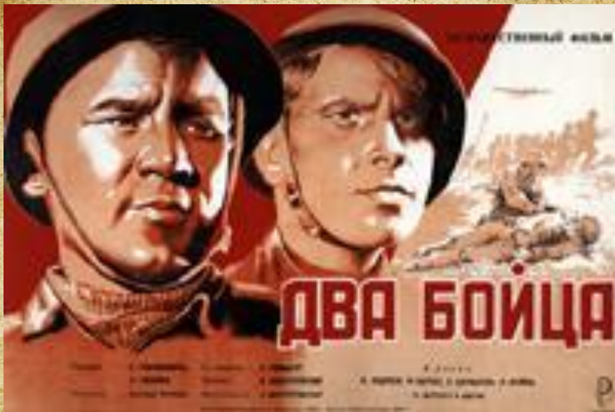
Два бойца Режиссёр: Леонид Луков 1943 г.

https://w-dog.ru/wallpaper/mark-bernes-boris-andreev-dva-bojca-1943-god-filmy-priblizhayushhie-pobedu-sssr/id/283254/