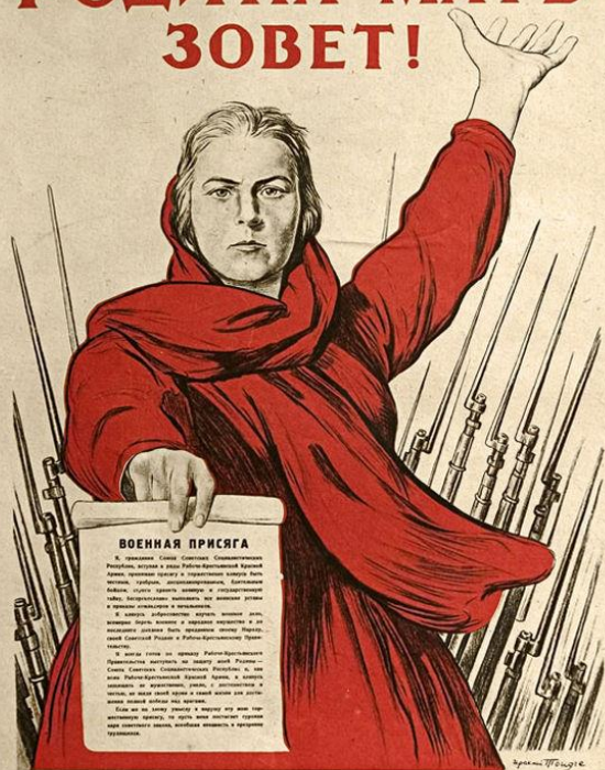
И. Тоидзе «Родина-мать зовет» 1941 г.

https://www.livemaster.ru/topic/1221095-iskusstvo-v-gody-velikoj-otechestvennoj-vojny