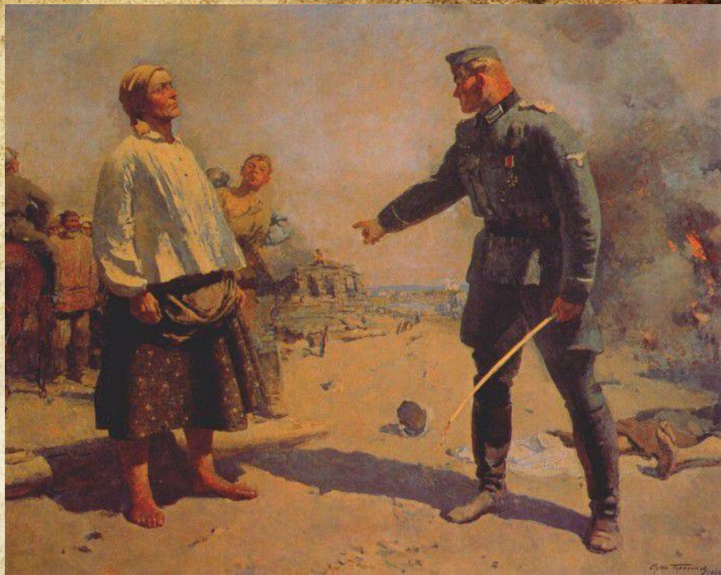
С. В. Герасимов «Мать партизана» 1943 г.

О стойкости и мужестве советских людей, о героизме и бесстрашии советской женщины-матери рассказал художник С. В. Герасимов в картине «Мать партизана».